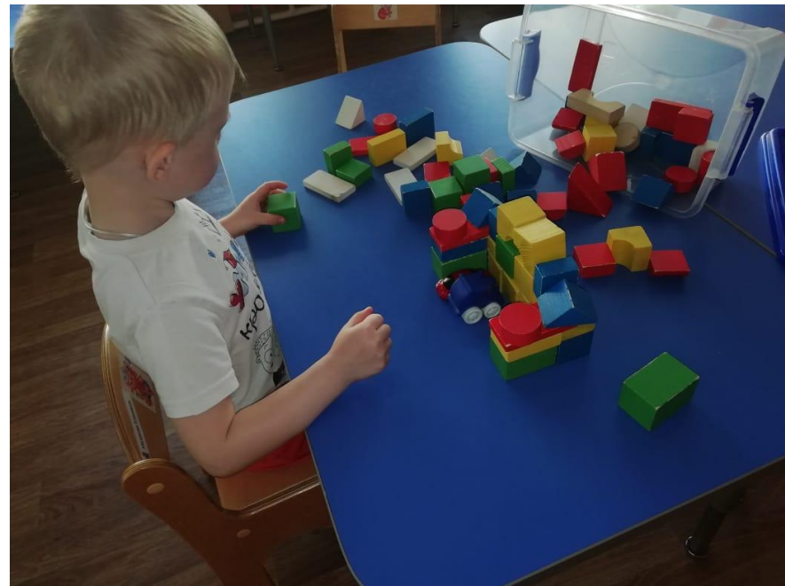
« Гараж »

Строительная игра - это такая деятельность детей, основным содержанием которой является отражение окружающей жизни в разных постройках и связанных с ними действиях. Во время игры дети организуют и улучшают игровое пространство.