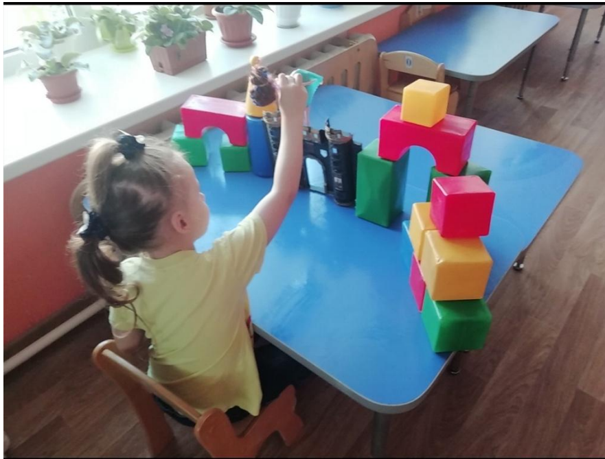
« Замок феи »