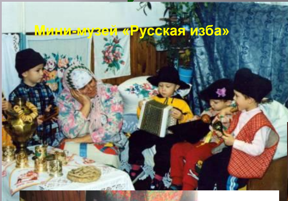
Мини-музей «Русская изба»