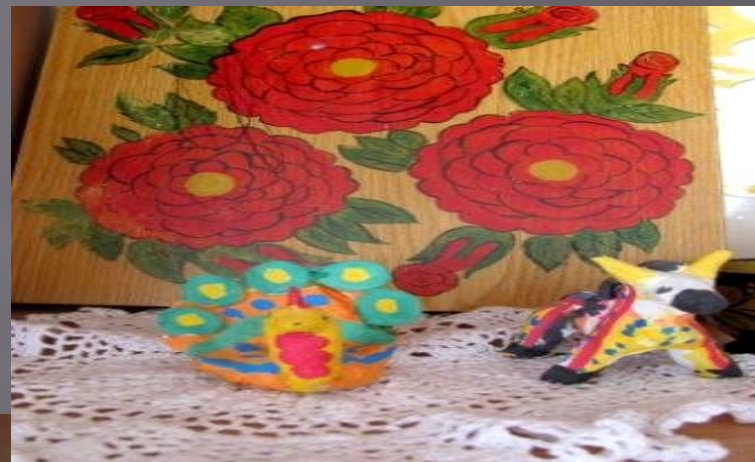
«Игрушки народных промыслов»