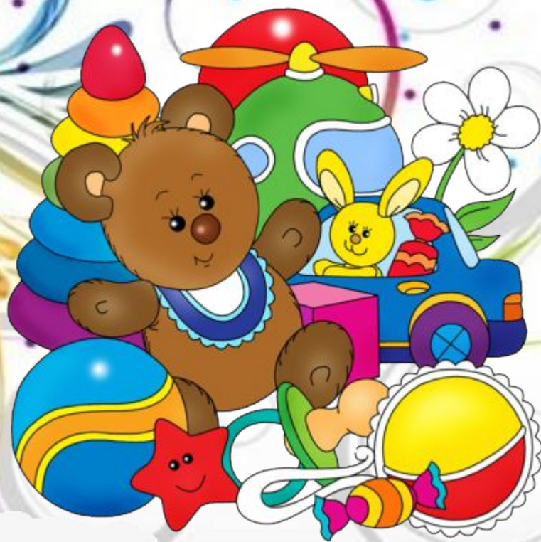
Фото отчёт Воспитателей 3 группы О проведении с 26.11.12 по 30.11.12 Недели «Игры и игрушки»