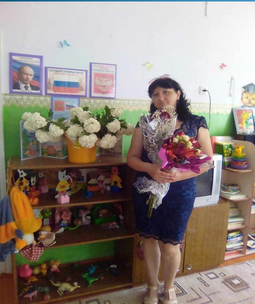
ФОТО ОТЧЕТ О ПРОДЕЛАННОЙ РАБОТЕ ЗА ГОД