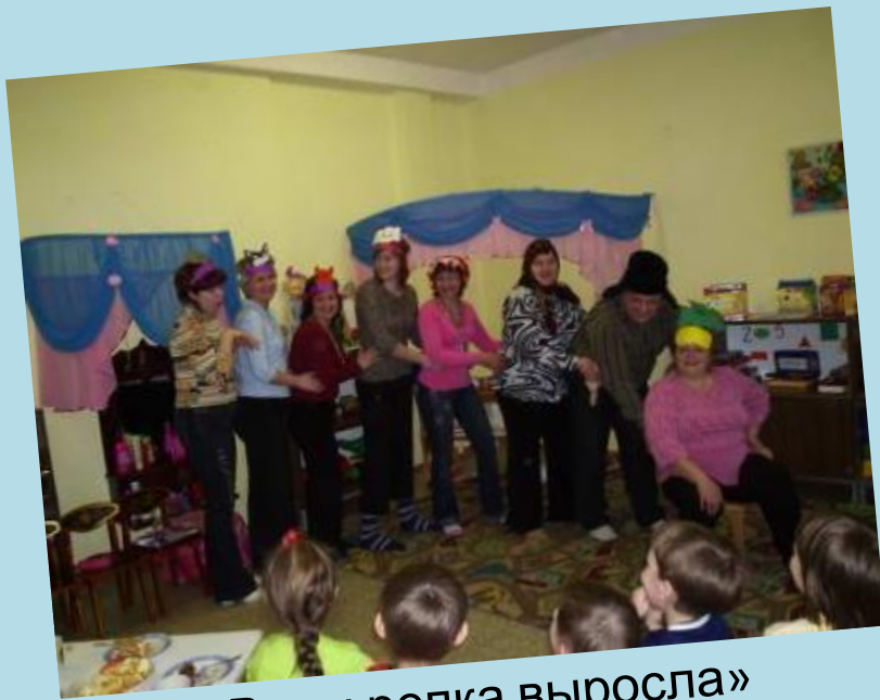
«Вот и репка выросла»