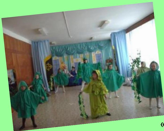
Сказка «Спящая красавица»