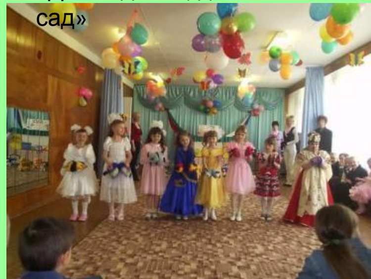
«До свидания, детский сад»