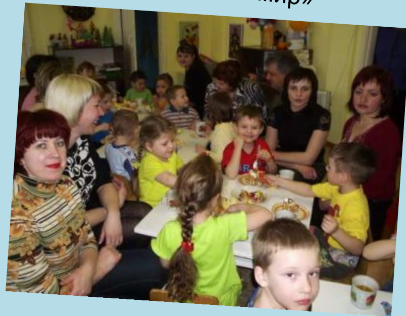
«Вместе и чай вкусней»