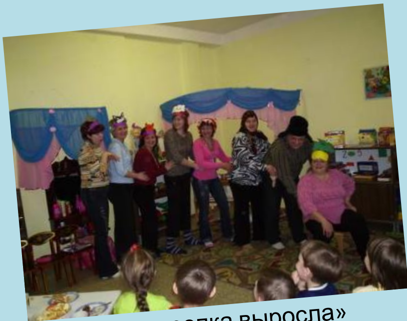
«Вот и репка выросла»