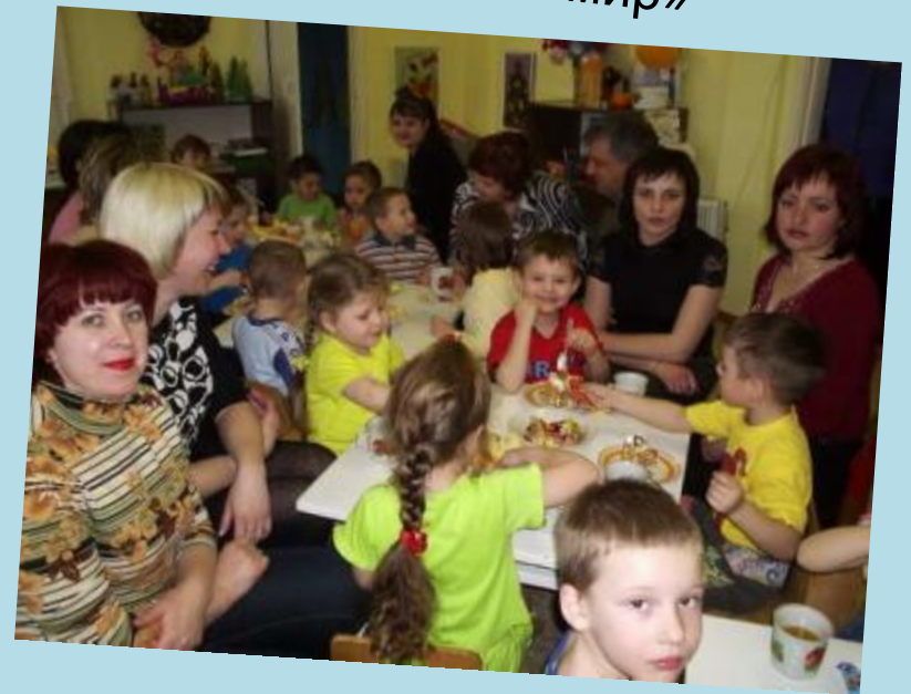
«Вместе и чай вкусней»