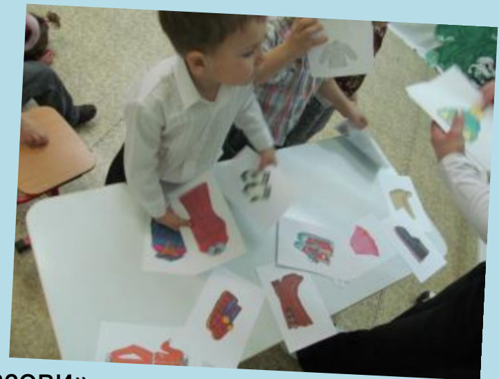
«Найди и назови»