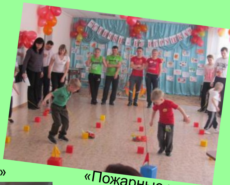
«Пожарные на учении»