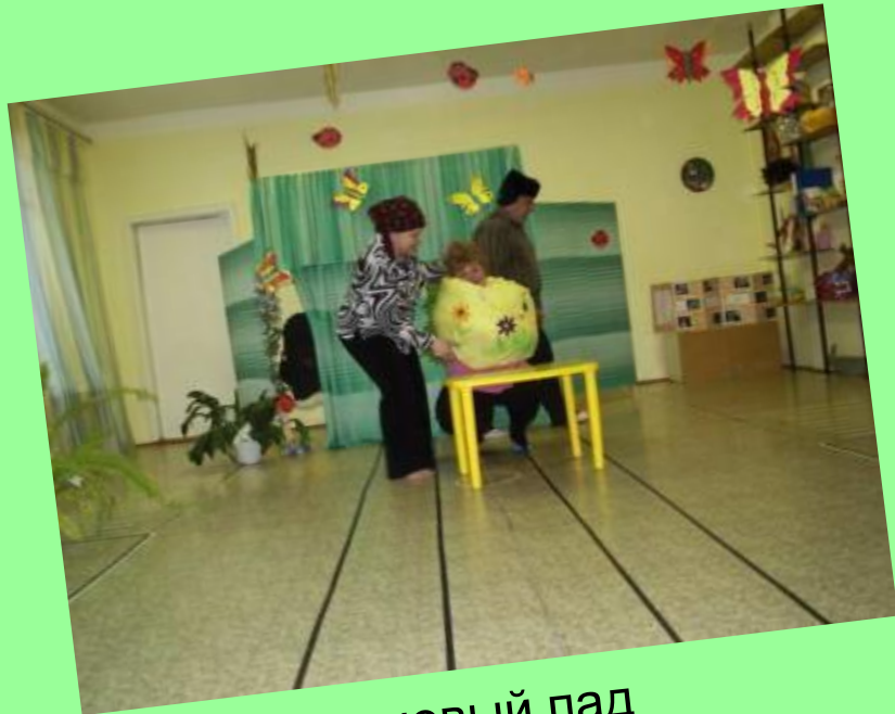
Сказка на новый лад