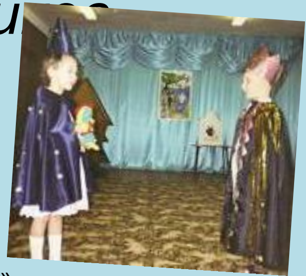
«Со сказкой в ногу»