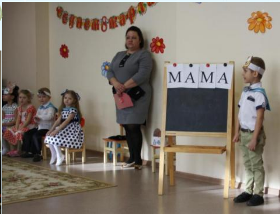
Сценка: «Урок в лесной школе»