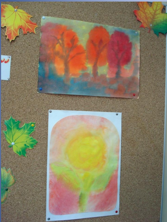
«Рисование по мокрому»