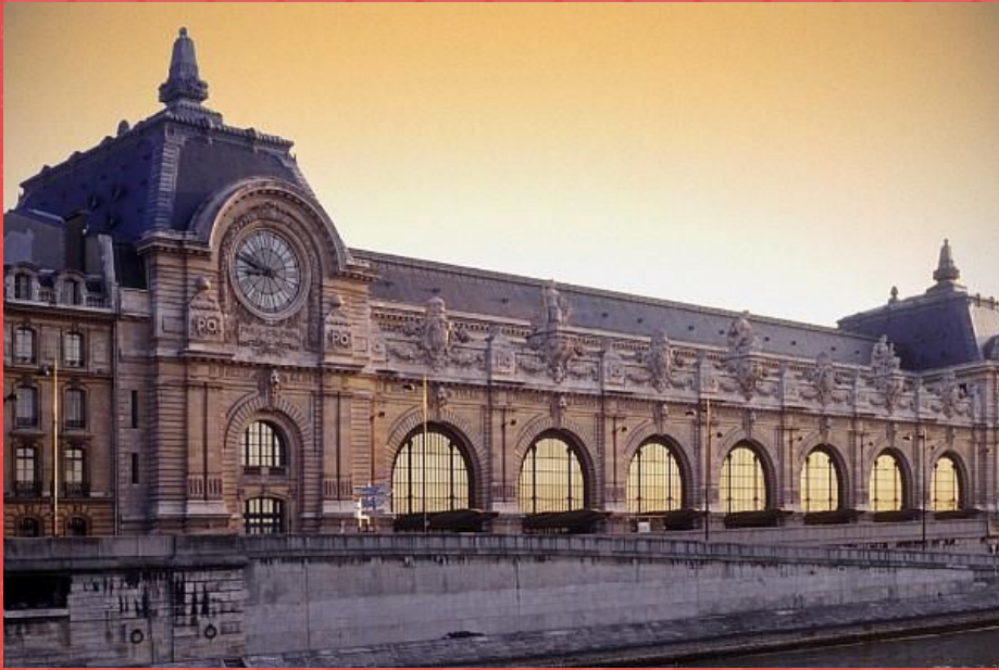
музей д'Орсэ (2 млн.)