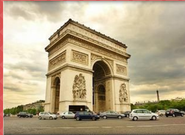
Триумфальная арка (1 млн.)