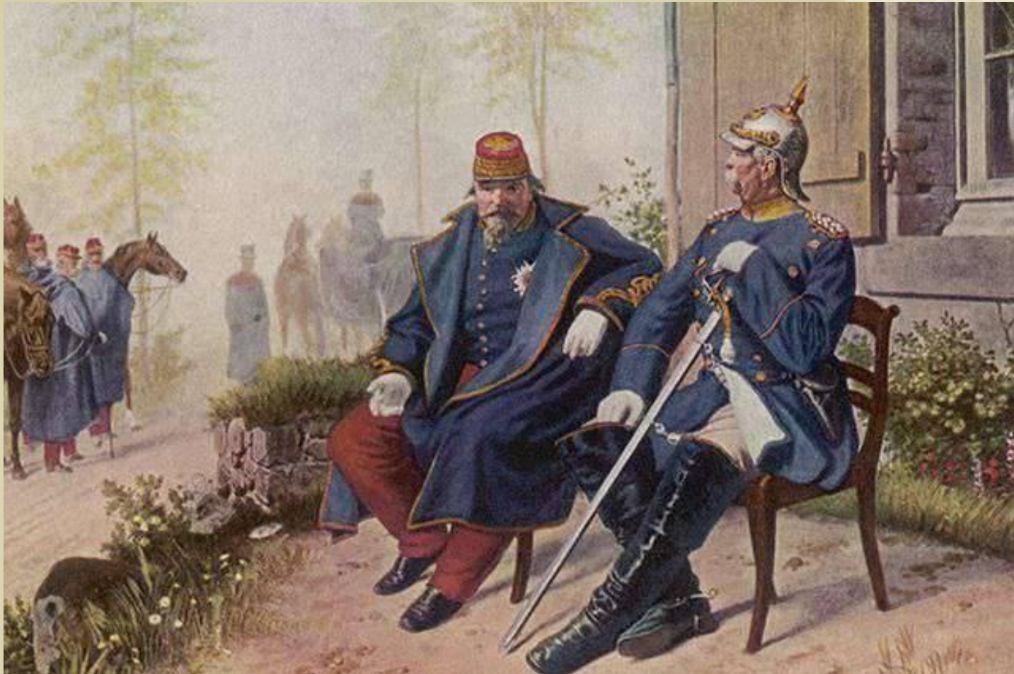
Полонений Наполеон III розмовляє з Бісмарком після битви при Седані