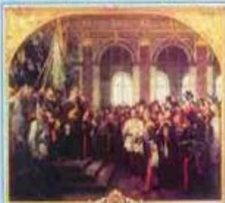
Проголошення Німецької імперії (Версаль, 1871 р.)