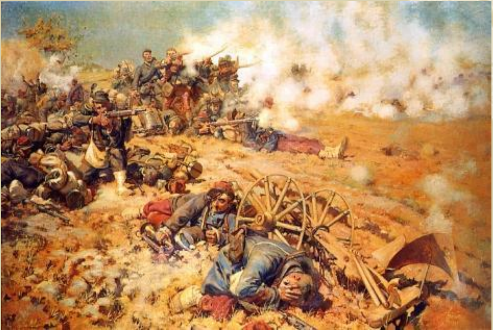
Поразка французької армії під Седаном