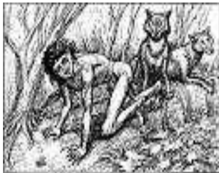
Волк с девочкой в джунглях