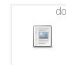
Чем так важны для