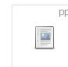
Роль чтения на этапе