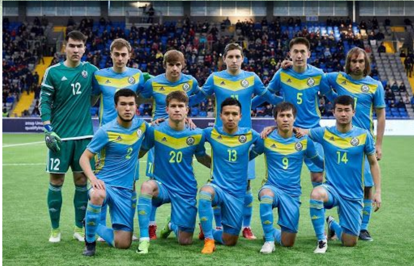
Қазақстан Ұлттық футбол құрамасы

Командада қақпашыны қосқанда 11, аз дегенде 7 ойыншы болады, 7 ойыншыдан кеміп кетсе, команда жеңілді деп есептейді. Ойын 2 таймнан тұрады. Ойын ұзақтығы – 90 минут, 1- таймнан кейін(45мин) 10-15мин үзіліс жасалады. Әр ойыншының жеке міндеттері болады. Шабуылшы, жартылай қорғаушы, қорғаушы, қақпашы.