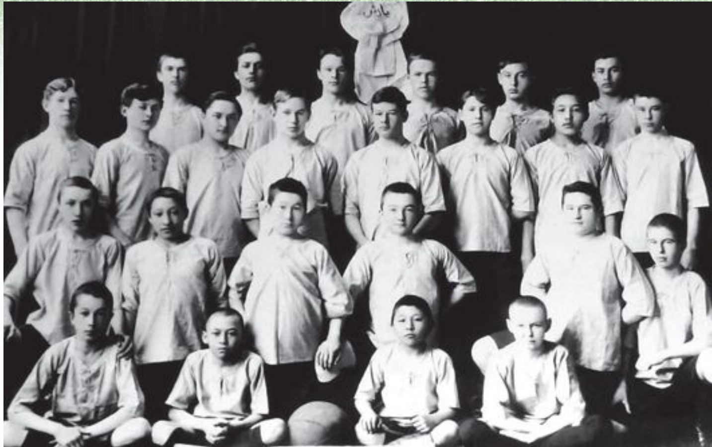
«Жарыс» футбол командасы

Жер бетінде футболмен 40 миллиондай адам айналысады. Қазақстан футболы 1914 жылдан басталады. 1913 жылы Семей қаласында «Жарыс» командасы құрылды. Осы командада қазақтың ұлы жазушысы Мұхтар Әуезов жартылай қорғаушы болып ойнаған.