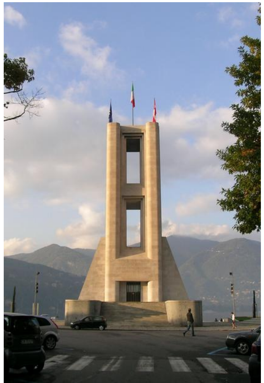
Джузеппе Терраньи. Монумент погибшим в Первой мировой войне. 1930-1933