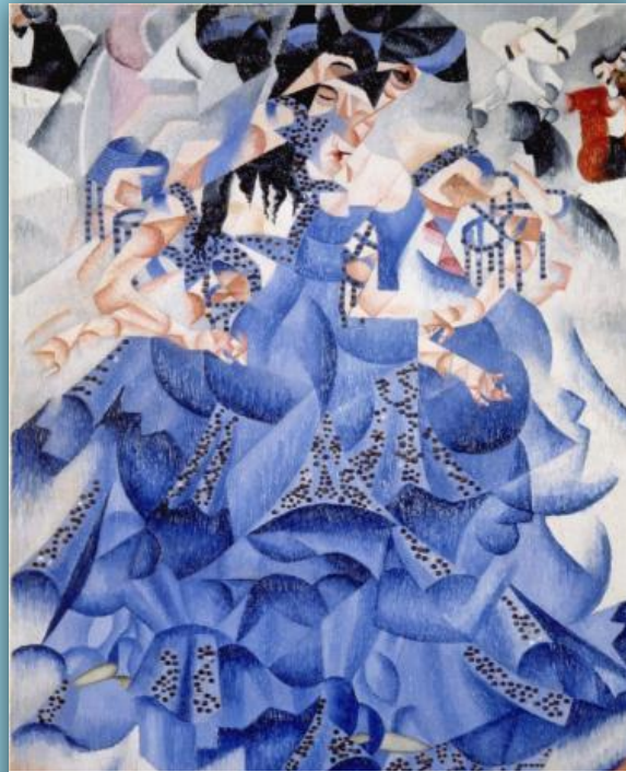
Джино Северини. 1912 . Балерина в голубом