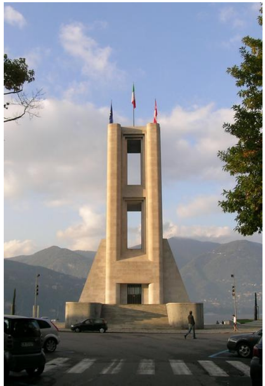
Джузеппе Терраньи. Монумент погибшим в Первой мировой войне. 1930-1933