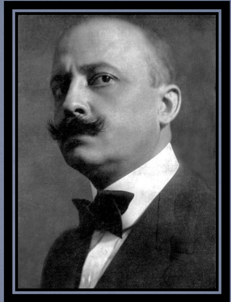
Филиппо Томмазо Маринетти (1876 — 1944)

В отличие от акмеизма, футуризм как течение в отечественной поэзии возник отнюдь не в России. Это явление целиком привнесено с Запада, где оно зародилось и было теоретически обосновано. Родиной нового модернистского движения была Италия, а главным идеологом итальянского и мирового футуризма стал известный литератор Филиппо Томмазо Маринетти (1876-1944), выступивший 20 февраля 1909 года на страницах субботнего номера парижской газеты «Фигаро» с первым «Манифестом футуризма», в котором была заявлена «антикультурная, антиэстетическая и антифилософская» его направленность.