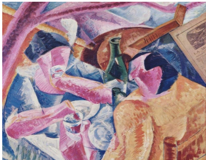
Умберто Боччони. Под перголой в Неаполе