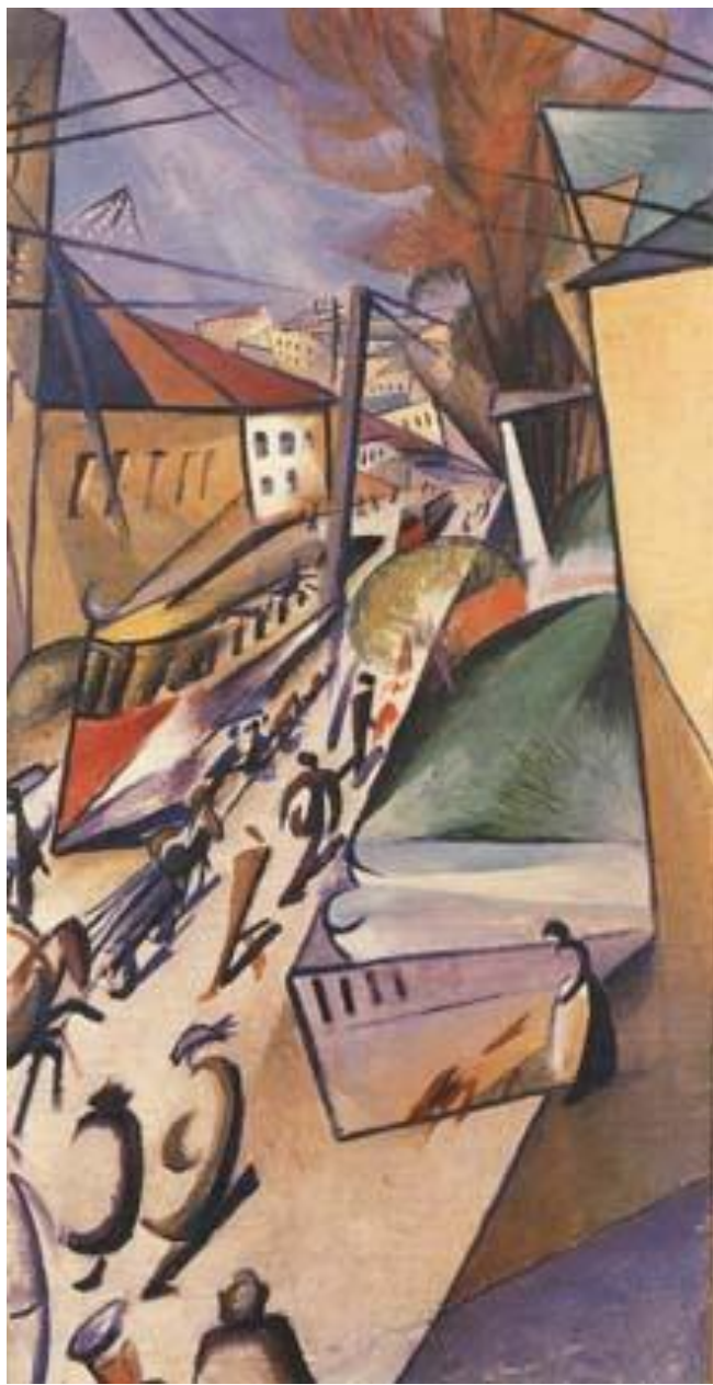
А. Богомазов. Трамвай. 1914