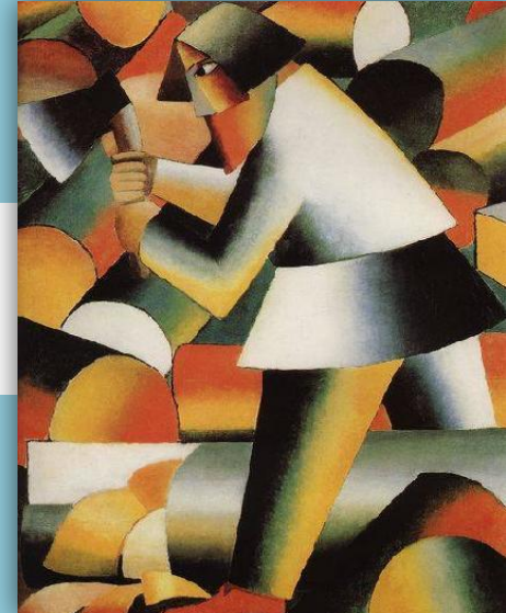
К. Малевич. Лесоруб. 1912 - 1913.