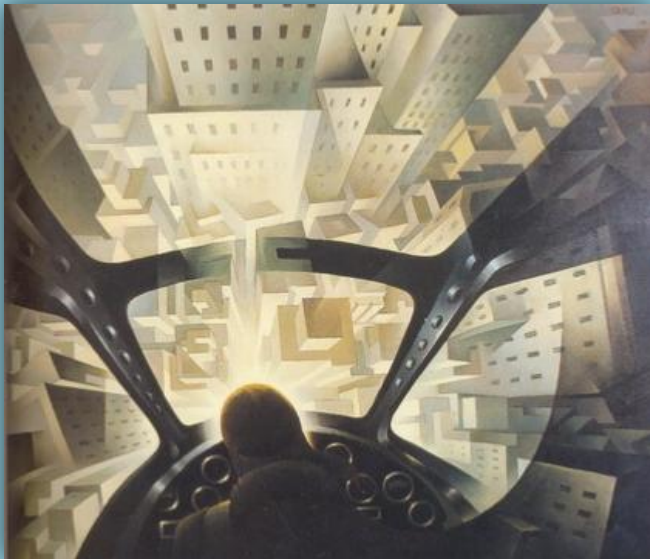
Туллио Крали. Погружаясь в городское пространство. 1939