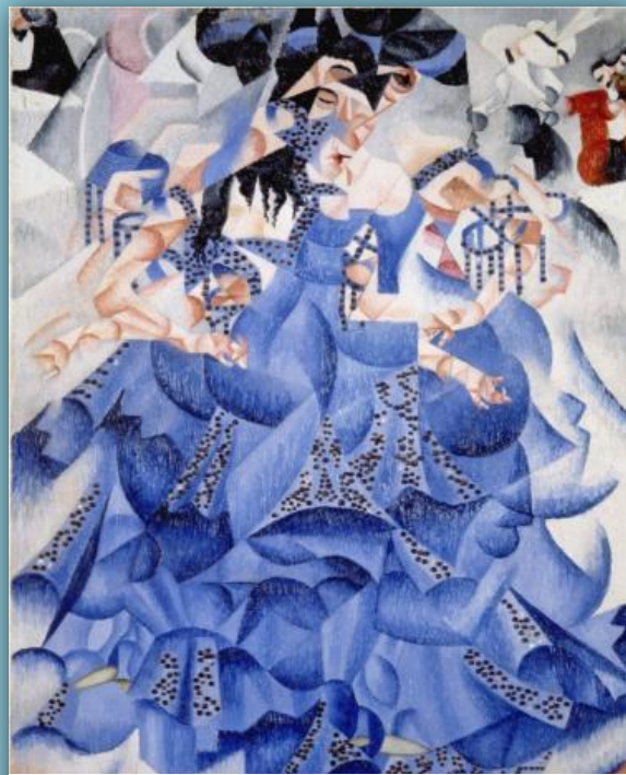
Джино Северини. 1912 . Балерина в голубом