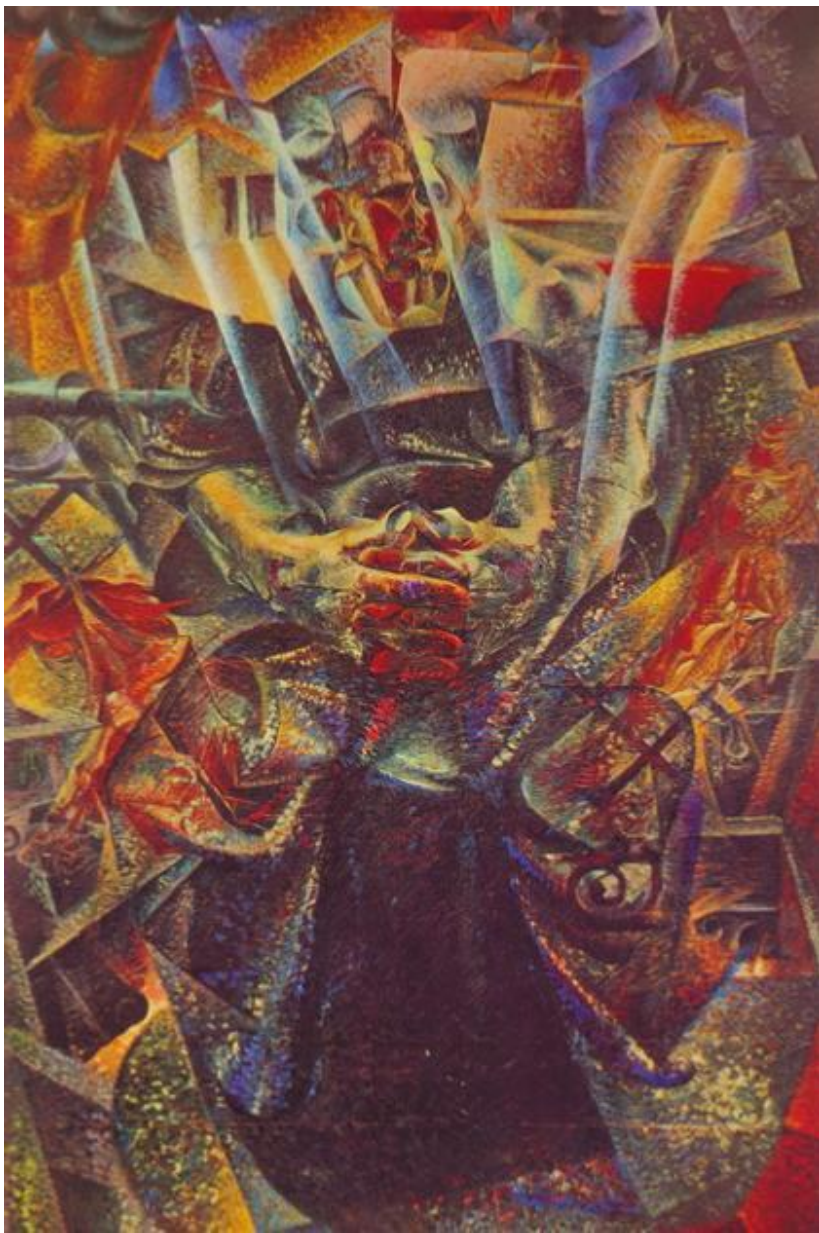
Умберто Боччони. Материя. 1912