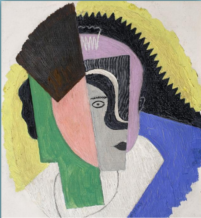
Джино Северини. Голова.