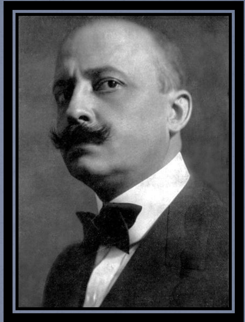
Филиппо Томмазо Маринетти (1876 — 1944)

В отличие от акмеизма, футуризм как течение в отечественной поэзии возник отнюдь не в России. Это явление целиком привнесено с Запада, где оно зародилось и было теоретически обосновано. Родиной нового модернистского движения была Италия, а главным идеологом итальянского и мирового футуризма стал известный литератор Филиппо Томмазо Маринетти (1876-1944), выступивший 20 февраля 1909 года на страницах субботнего номера парижской газеты «Фигаро» с первым «Манифестом футуризма», в котором была заявлена «антикультурная, антиэстетическая и антифилософская» его направленность.