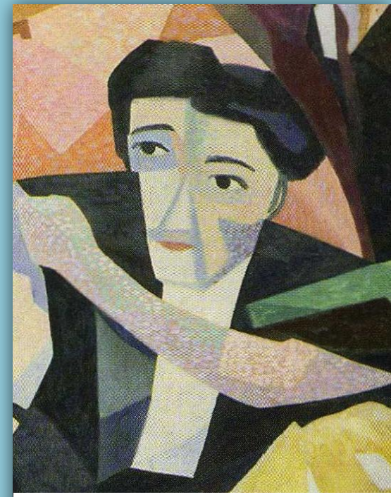
Джино Северини. Автопортрет