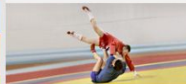
Кубок мира по самбо среди студентов

Проведение дополнительного отбора в наградную группу в рамках Всероссийского конкурса «Лица Универсиады 2013»