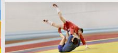
Кубок мира по самбо среди студентов

Проведение дополнительного отбора в наградную группу в рамках Всероссийского конкурса «Лица Универсиады 2013»