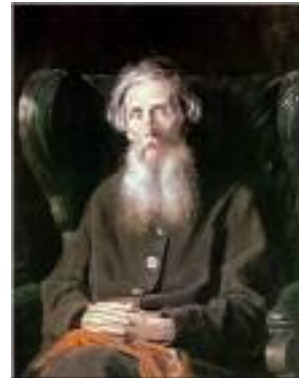
Даль Владимир Иванович