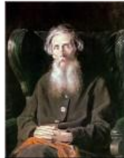
Даль Владимир Иванович