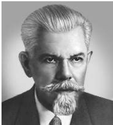
Ожегов Сергей Иванович