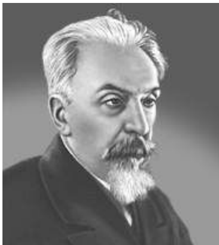
Щерба Лев Владимирович