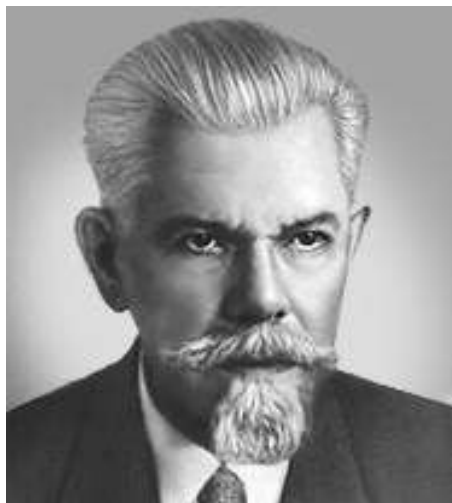
Ожегов Сергей Иванович