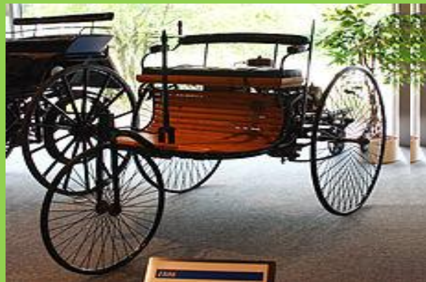
Автомобиль Бенца , 1885 год. Первый серийный автомобиль с двигателем внутреннего сгорания.