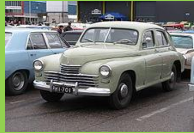
1946г. ГАЗ-М-20 «Победа»