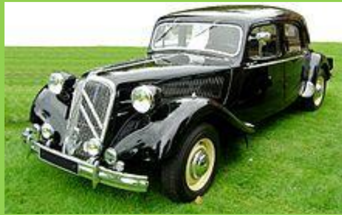
Citroën Traction Avant