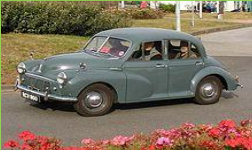
1953г. Morris Minor ( англ. ) Серия II.