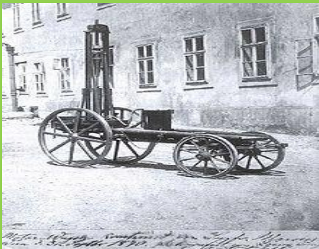
1870 год, Вена, Австрия: Первый в мире транспорт на бензине. «Первая машина Маркуса».