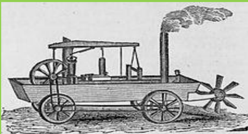
Первая американская машина. Машина – амфибия Оливер Эванс.