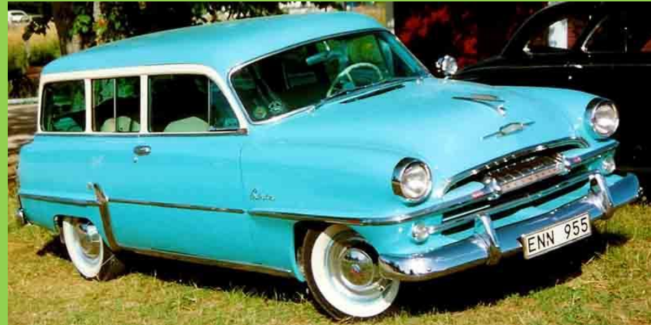
1954г. один из первых цельнометаллических универсалов.