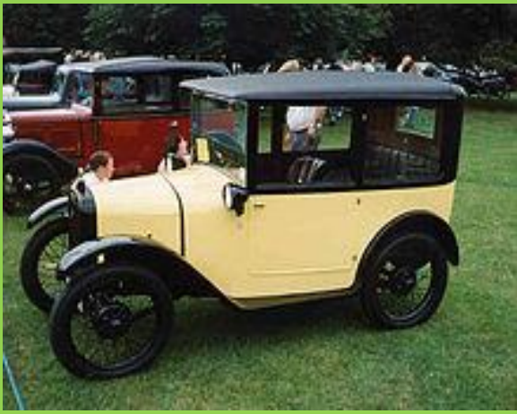
Austin 7 коробка-седан, 1926 год.