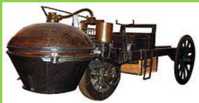
Вторая паровая телега Кюньо (1771г.)

История автомобиля началась ещё в 1768 году вместе с созданием паросиловых машин , способных перевозить человека .