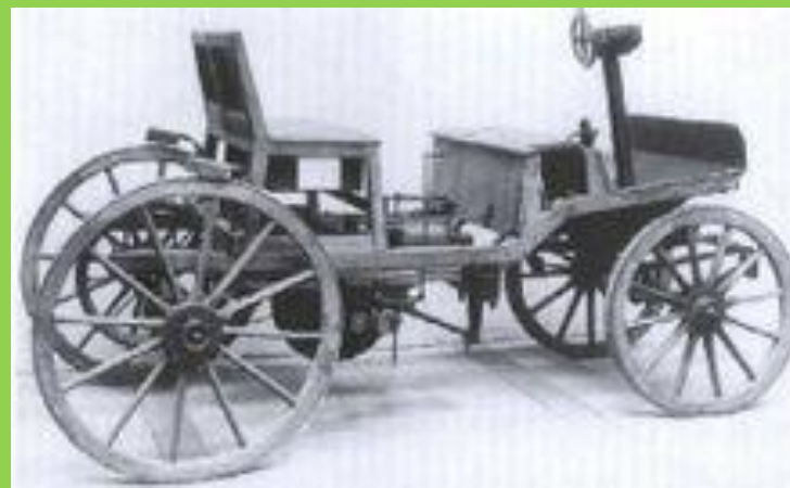
Вторая машина Маркуса 1888г.Вена.