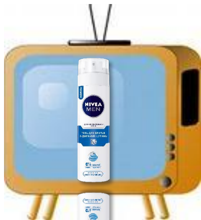
Анонс в ТВ-рекламе (2016)