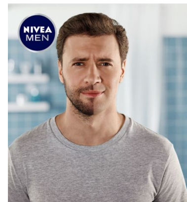
Активация в точках продаж в 2016