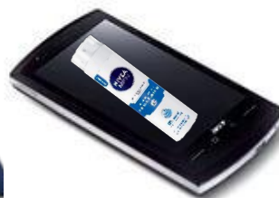
Интернет (2016 онлайн видео)