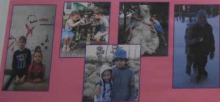
Мы разные, но очень любим друг друга!