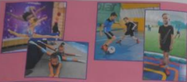
Я занимаюсь художественной гимнастикой, а Лёва играет в футбол