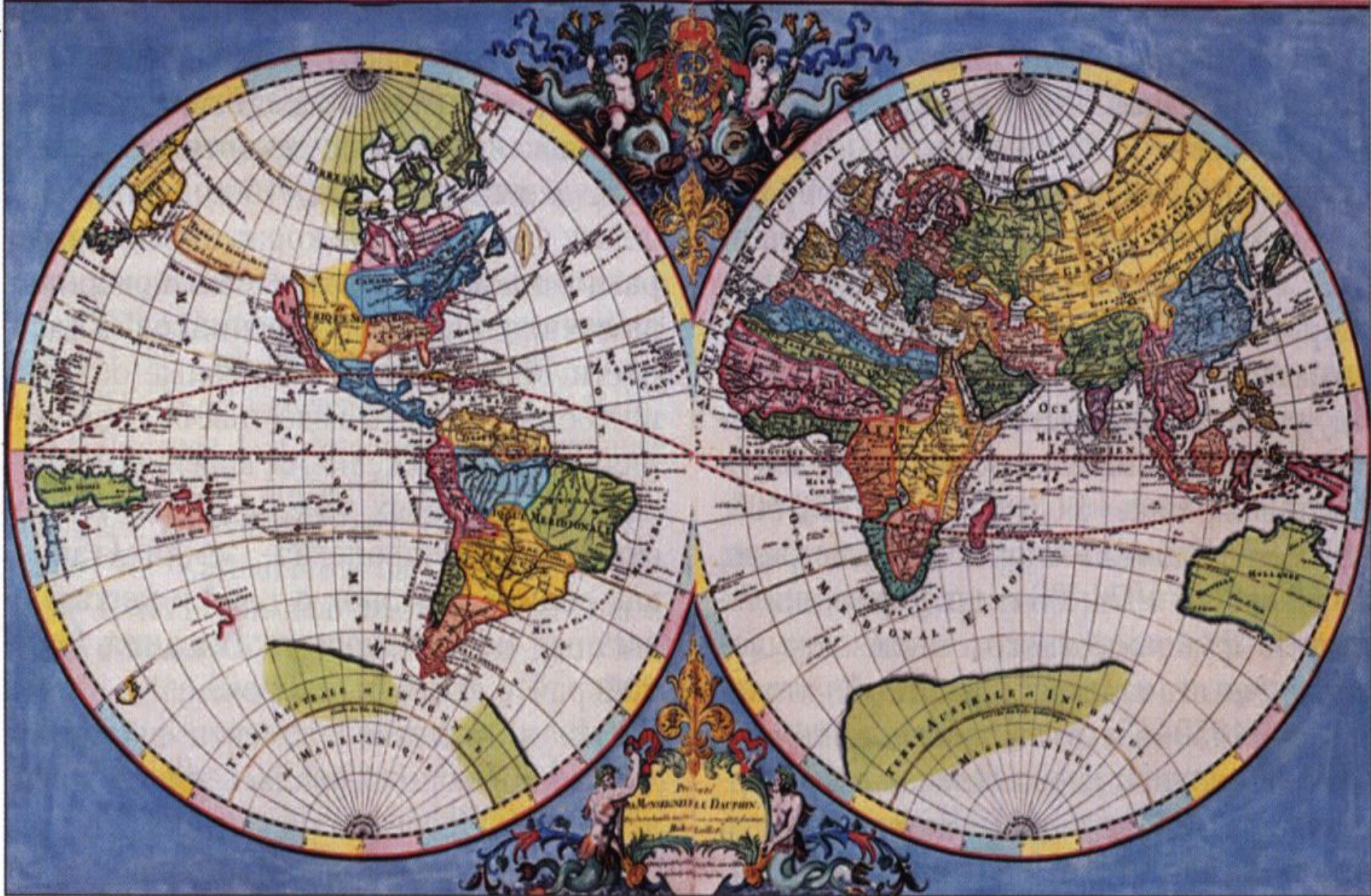
Карта полушарий французского картографа Н. Сансона, 1651.