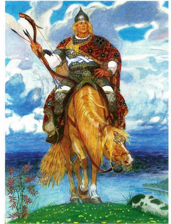
• АЛЁША ПОПОВИЧ •