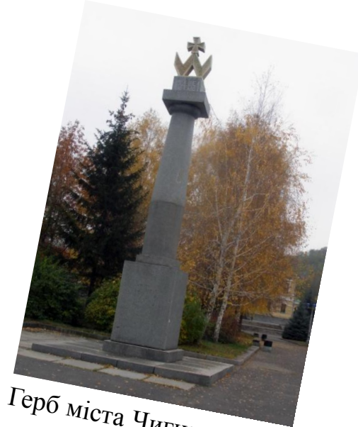
Герб міста Чигирина