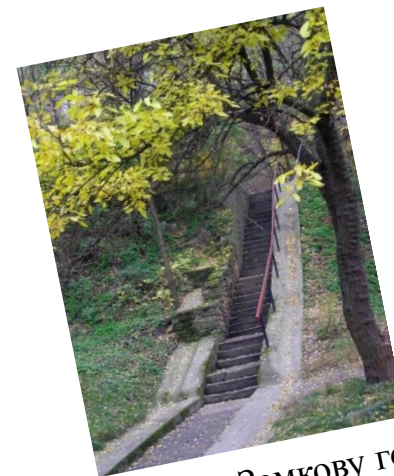
Сходи на Замкову гору