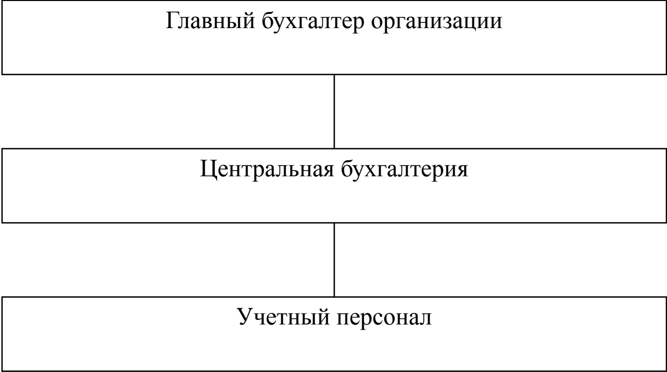
Схема централизованной организации учета