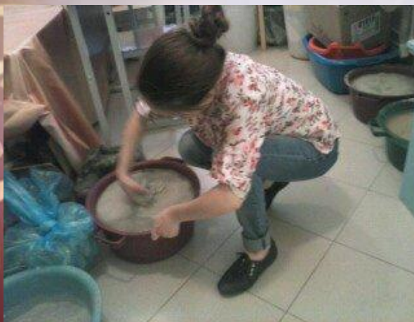
Замачивание глины для работы