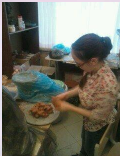
Лепка основы(плинт) практической работы