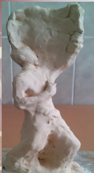
Выполнил: Майоров Виталий ученик 7 «Б» класса