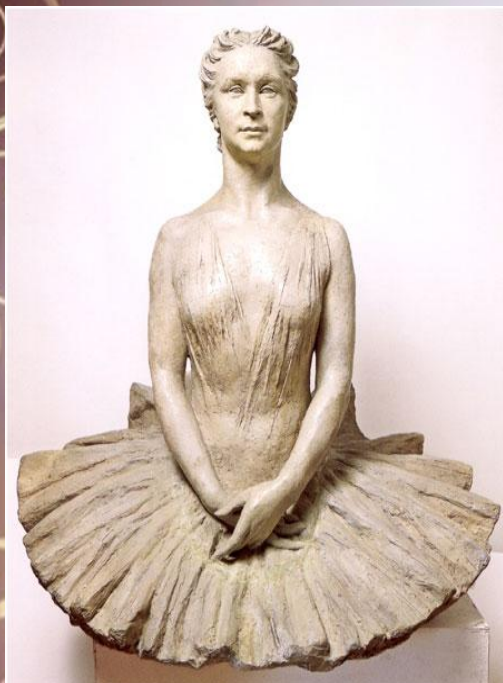
Сергея Тимофеевича Конёнкова. «Балерина Марина Семёнова». 1941г.