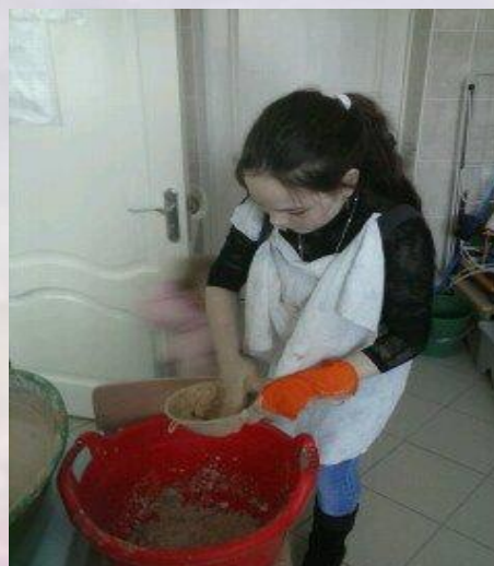
Очистка глины от примеси