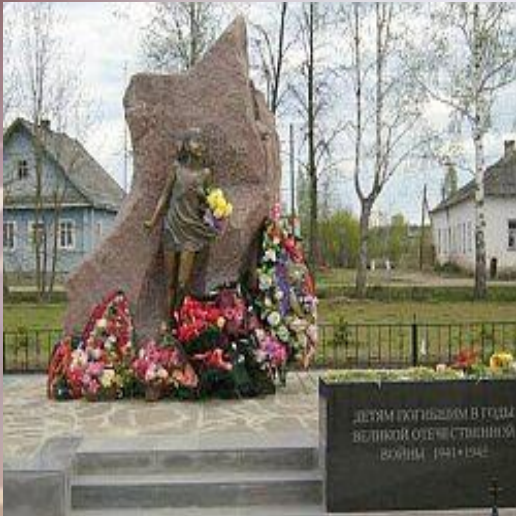
Памятник детям, погибшим в годы Великой Отечественной войны. Фетисов Виктор Георгиевич