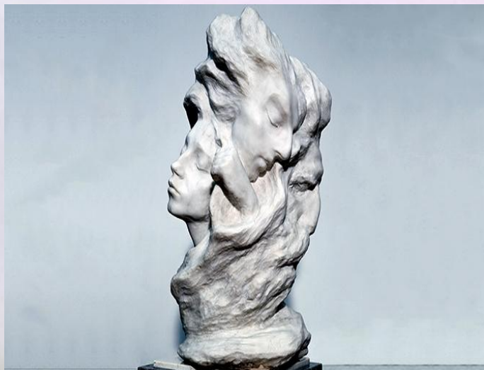
Ваза "Туман". Анна Семёновна Голубкина. 1904 г.