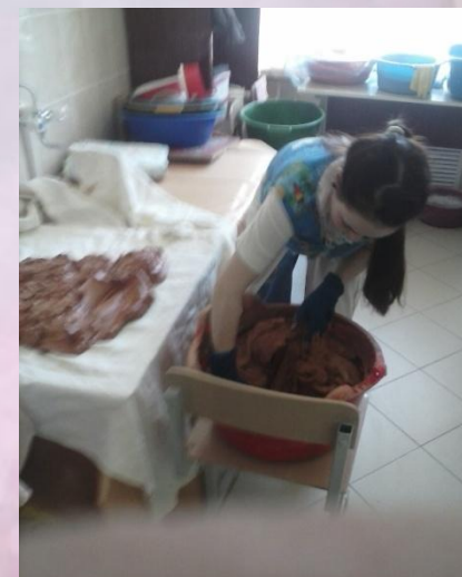
Подготовка глины к работе