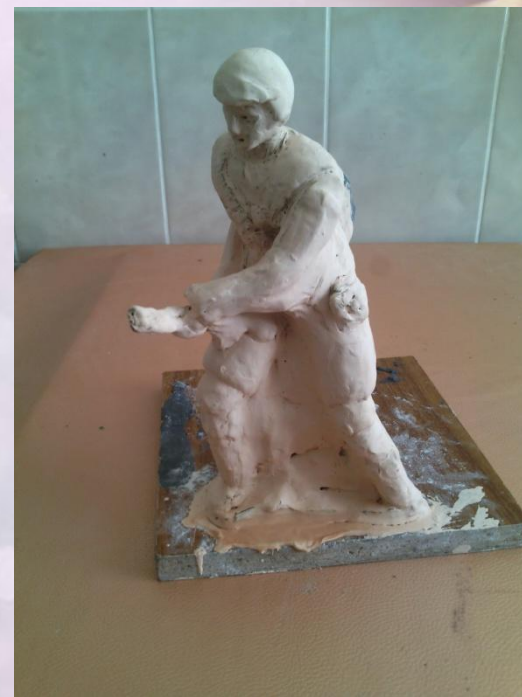
Выполнила: Стасюк Яна ученица 7 «Б» класса