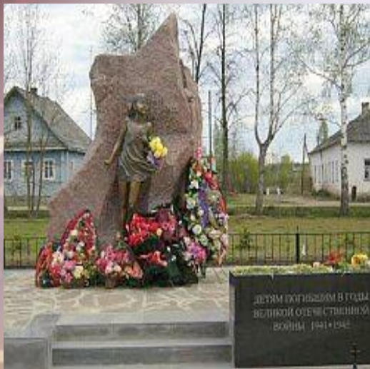
Памятник детям, погибшим в годы Великой Отечественной войны. Фетисов Виктор Георгиевич