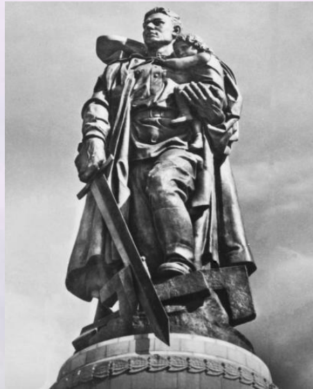
Памятник воинам Советской Армии, павшим в боях с фашизмом. Фетисов Виктор Георгиевич