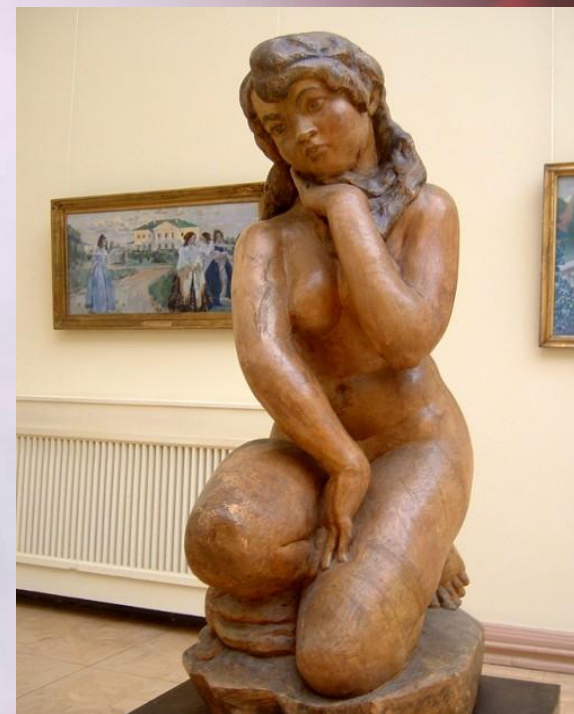
Сергея Тимофеевича Конёнкова. «Купальщица»