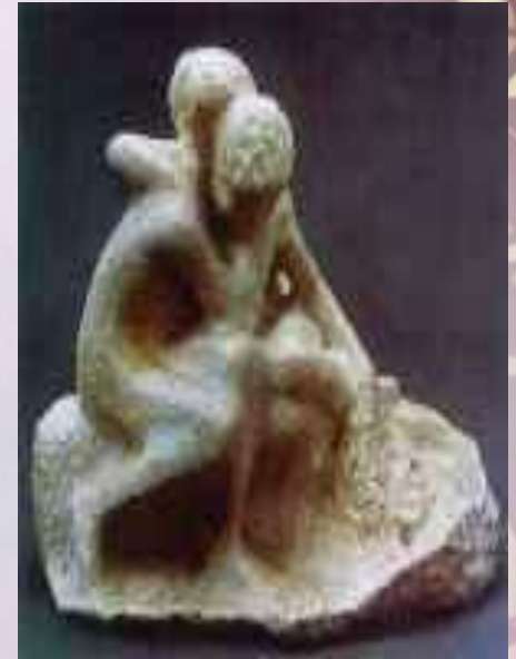
«Успокоение». Александр Терентьевич Матвеева 1905г.