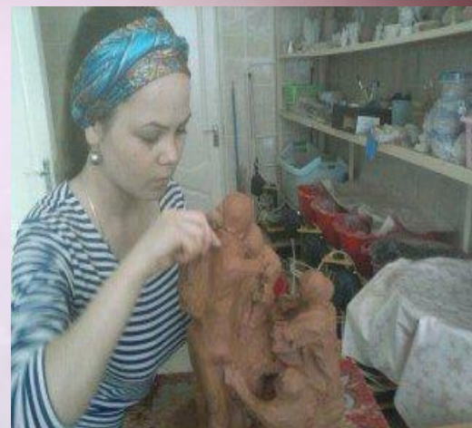
Лепка общей формы работы