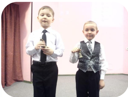
Песня «Пасхальное яичко»

КОНСУЛЬТАЦИИ ДЛЯ ПЕДАГОГОВ: «Как сделать повторение песен в группе содержательным и привлекательным» , «Готовимся к празднику» и др.