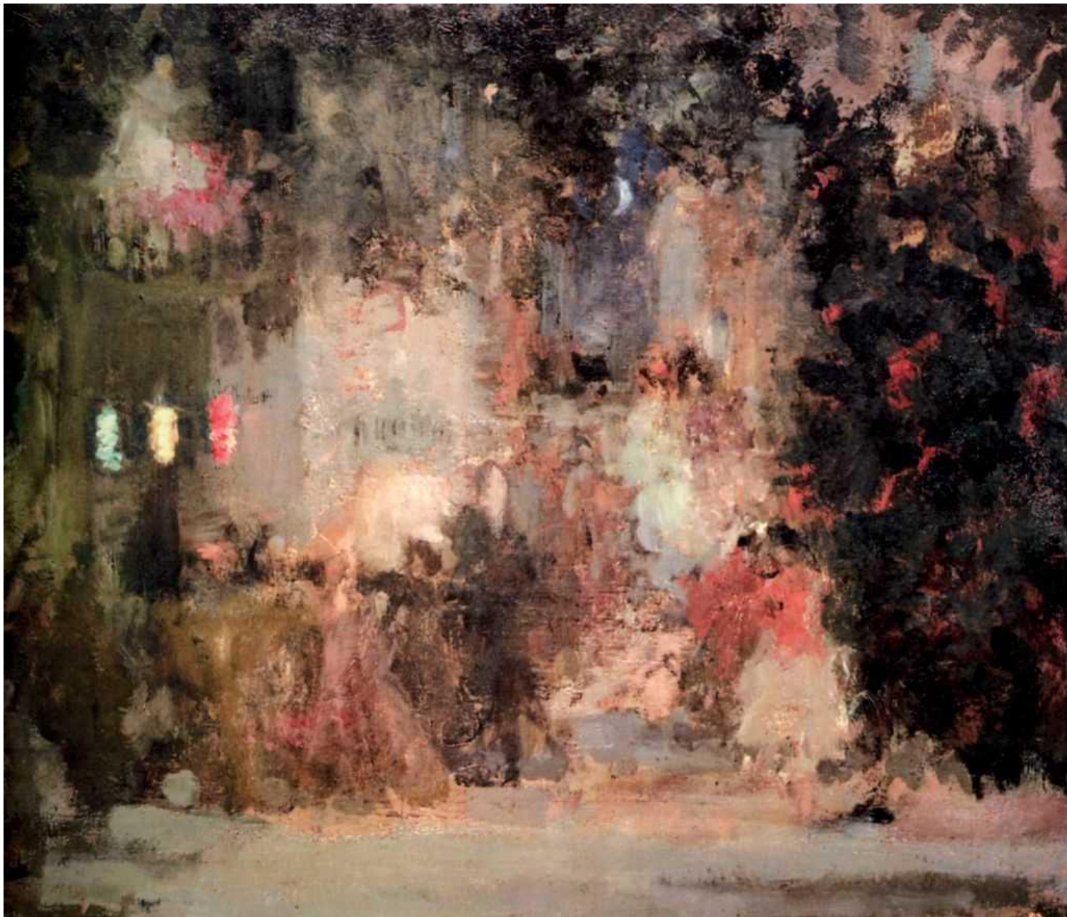
Сапунов Н. Н. «Эскиз декорации к опере Ж. Бизе "Кармен"» 1904