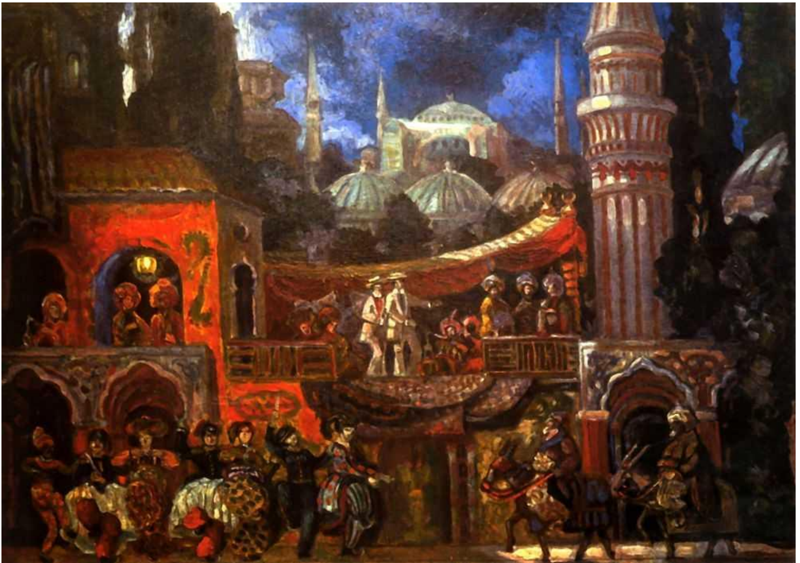
Судейкин С. Ю. «Декорация к "Развлечениям для девушек" Кузмина» 1911