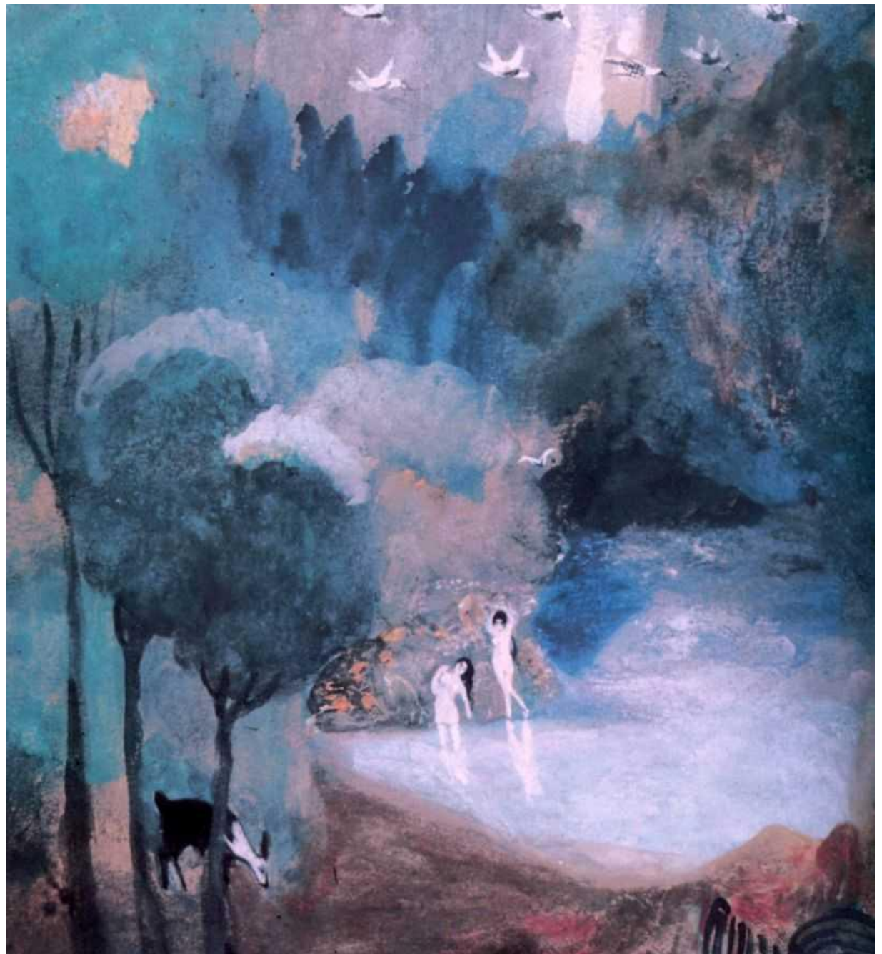
«Озеро фей» 1905