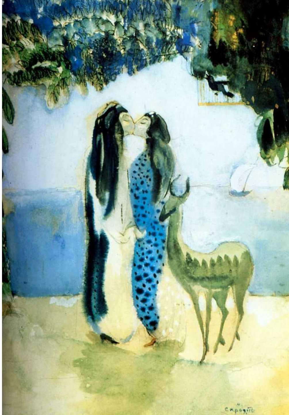
«Любовь» Сказка. 1906