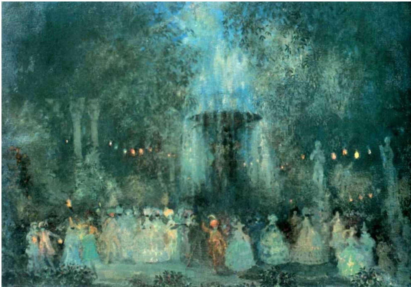
Сапунов Н. Н. «Маскарад» 1907