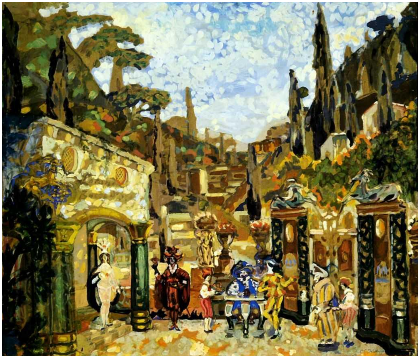
Судейкин С. Ю «Эскиз декорации к "Видимой стороне жизни" Бенавенте» 1912