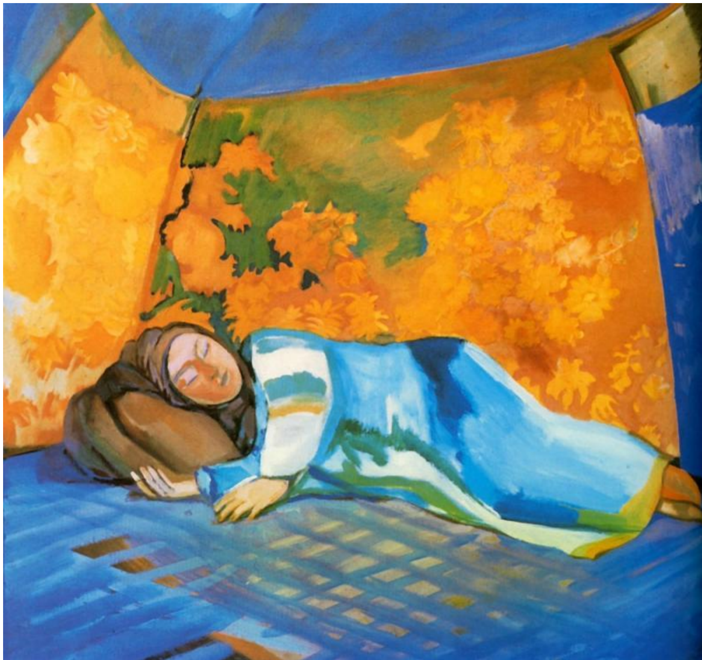
«Спящая в кошаре» 1911 г