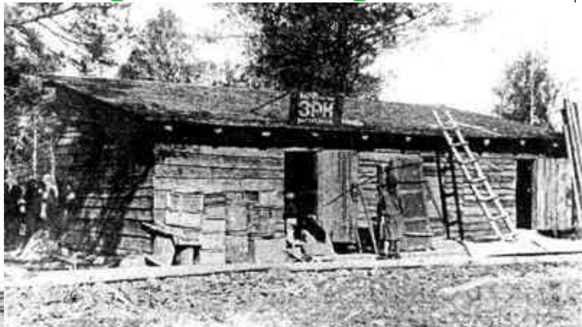
Первые жилые бараки