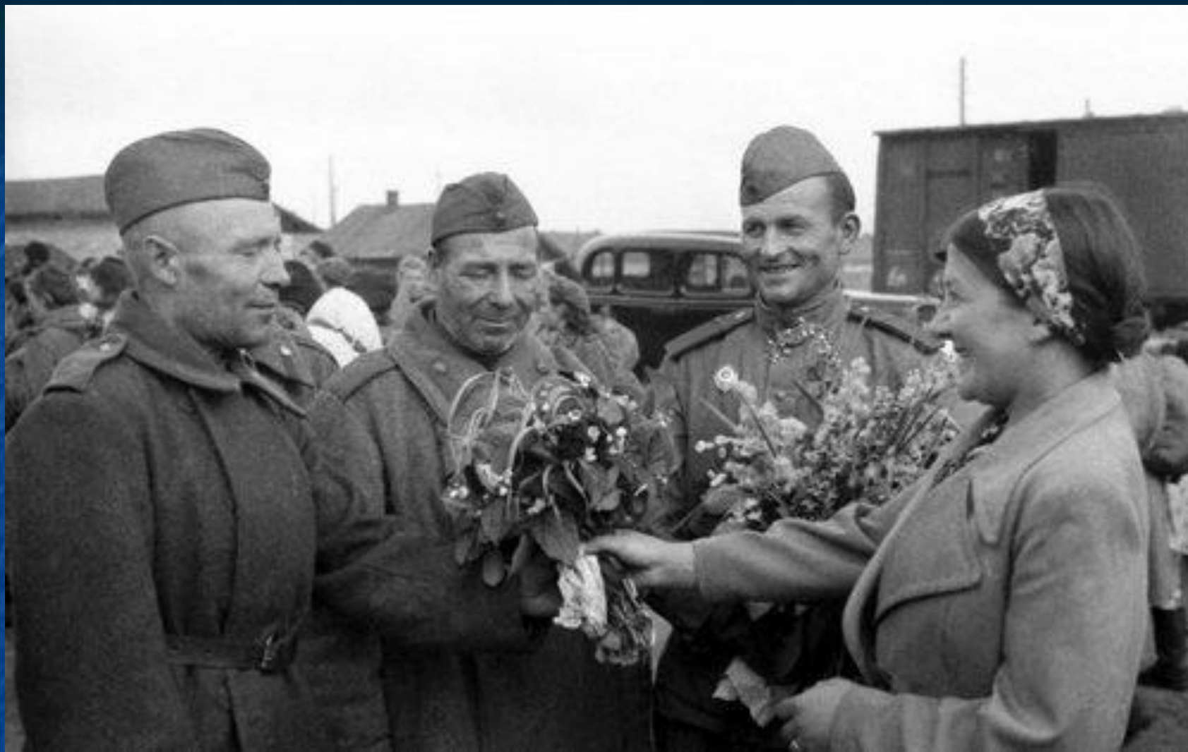
Встреча демобилизованных первой очереди