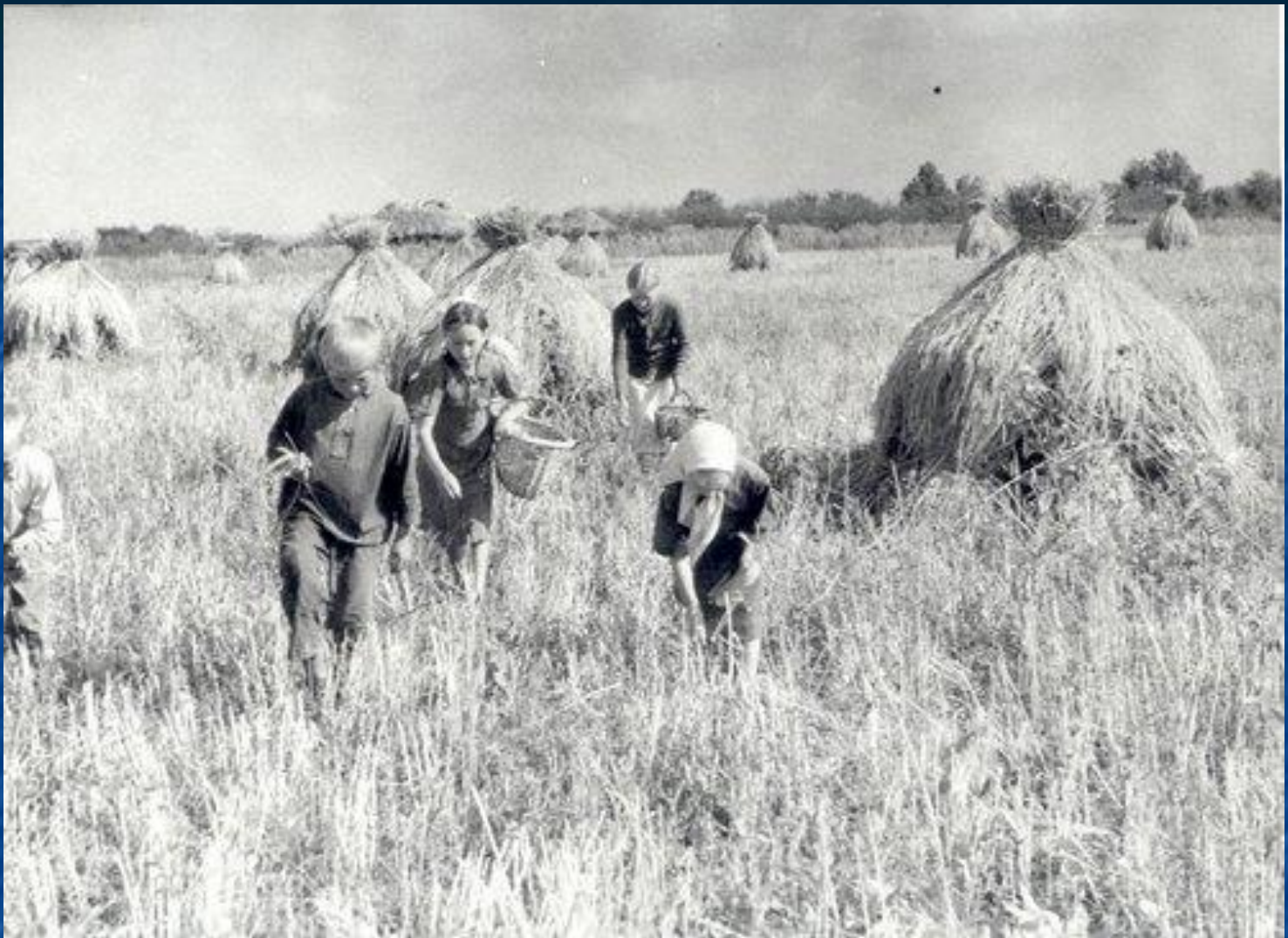
Школьники за сбором колосков в колхозе им. Пугачева Лысковского района