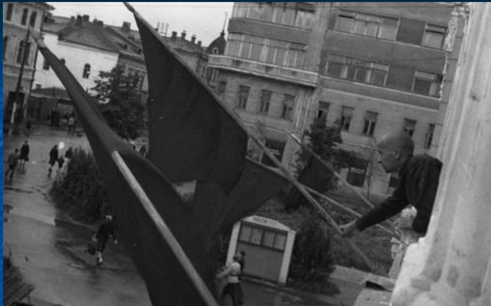
Вывешивание флагов в день капитуляции Германии