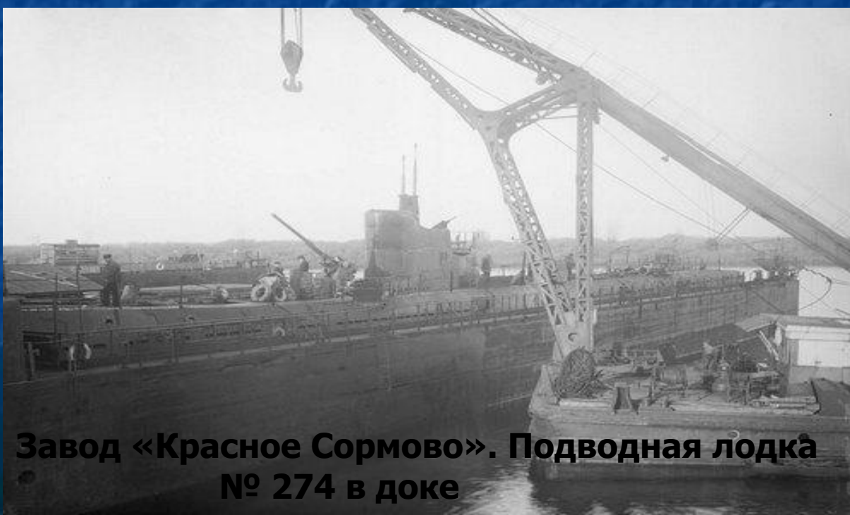
Завод «Красное Сормово». Подводная лодка № 274 в доке