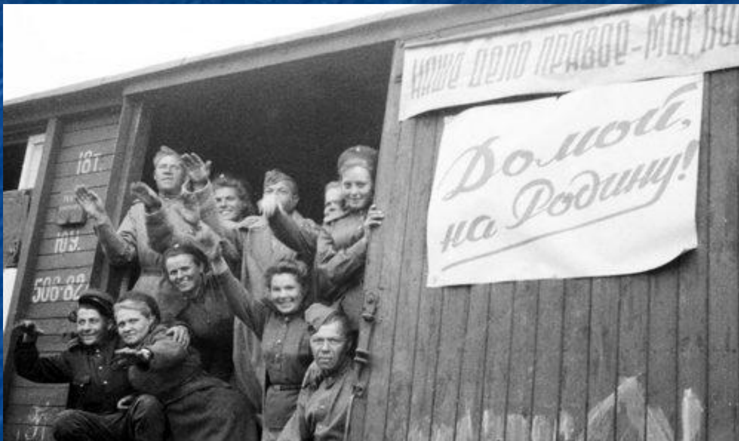
Первый эшелон демобилизованных горьковчан