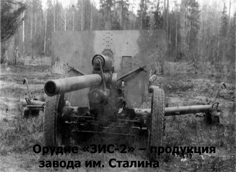
Орудие «ЗИС-2» – продукция завода им. Сталина