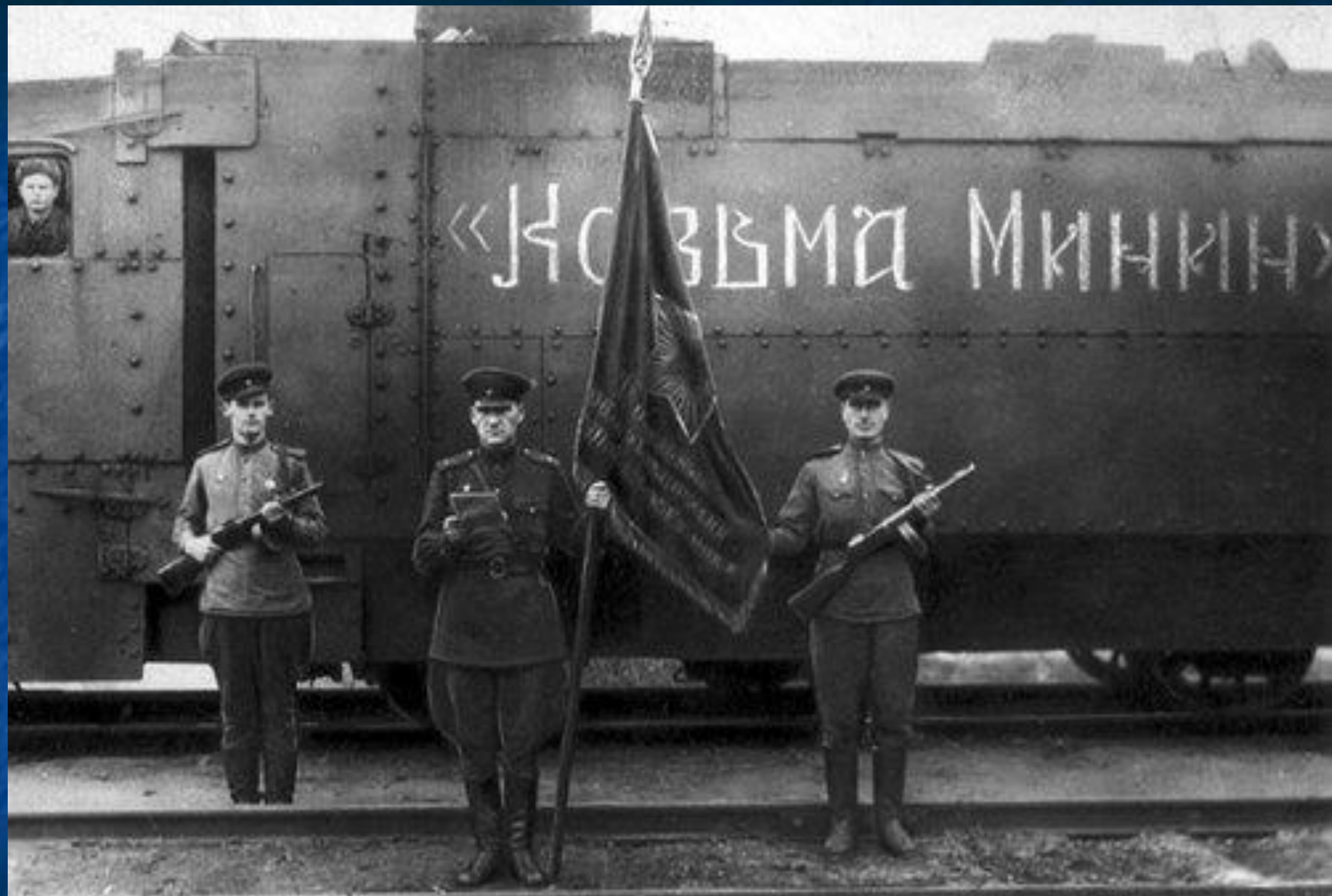
Бронепоезд «Козьма Минин»