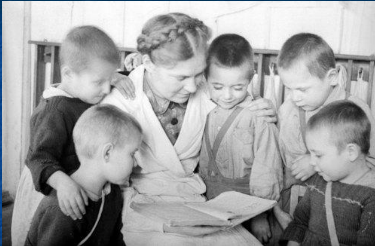
Детский дом для эвакуированных из Ленинграда детей. Горьковская область, Краснобаковский район