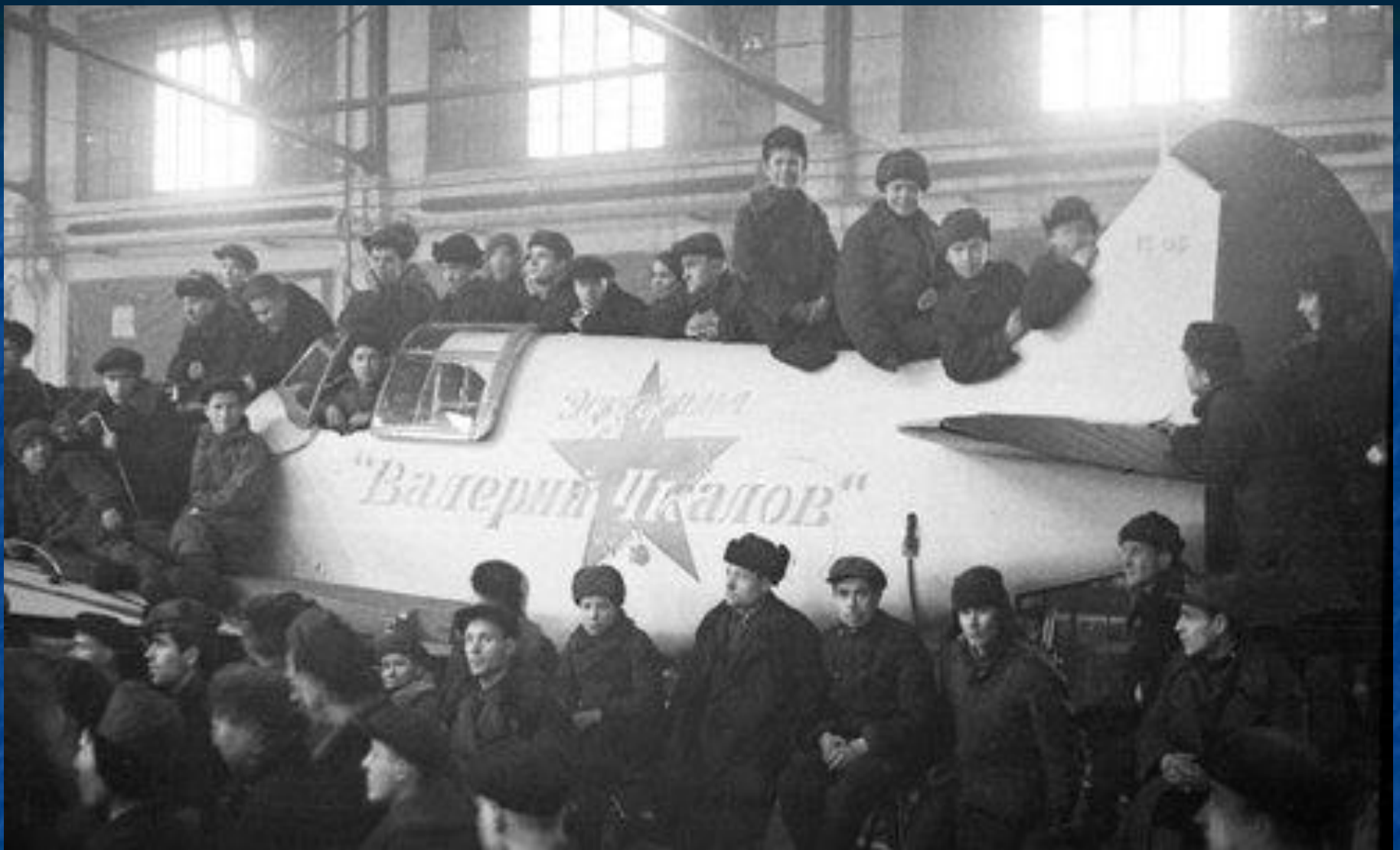
Митинг на заводе им. С. Орджоникидзе, посвященный передаче в Красную армию эскадрильи «Валерий Чкалов»