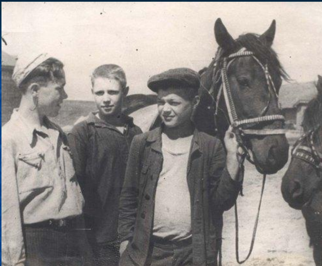
Группа молодых стахановцев колхоза им. С.М.Кирова Кстовского района