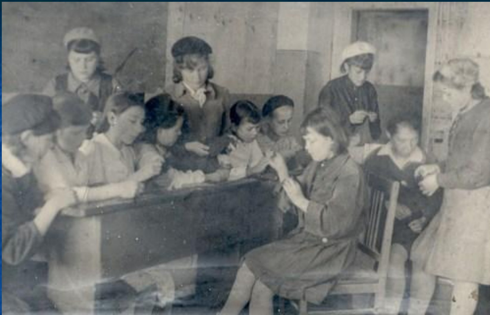
Учащиеся ремесленного училища № 1 за подготовкой подарков бойцам Красной армии