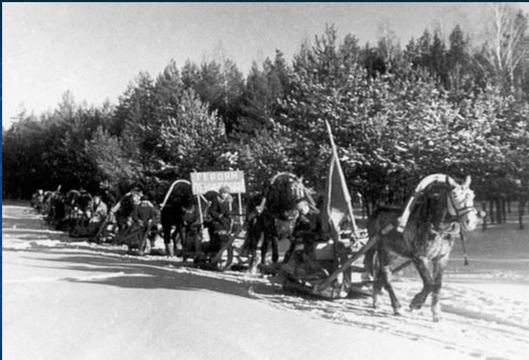
Обоз с подарками горьковчан для жителей Ленинграда.