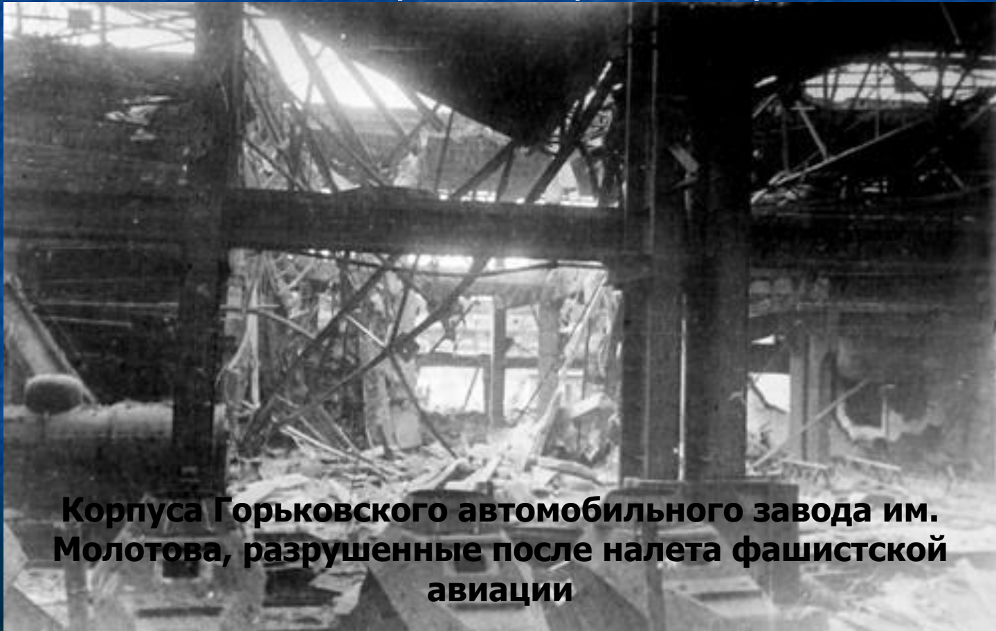
Корпуса Горьковского автомобильного завода им. Молотова, разрушенные после налета фашистской авиации

Налеты немецких бомбардировщиков причинили значительный ущерб многим заводам: им. В.И. Ленина, «Двигатель революции», автомобильному. Во время бомбардировки цехов Горьковского автозавода погибли 127 человек, ранено – 376. После этих налетов Горьковский бригадный район ПВО, охранявший город, был введен в состав действующей Красной армии.