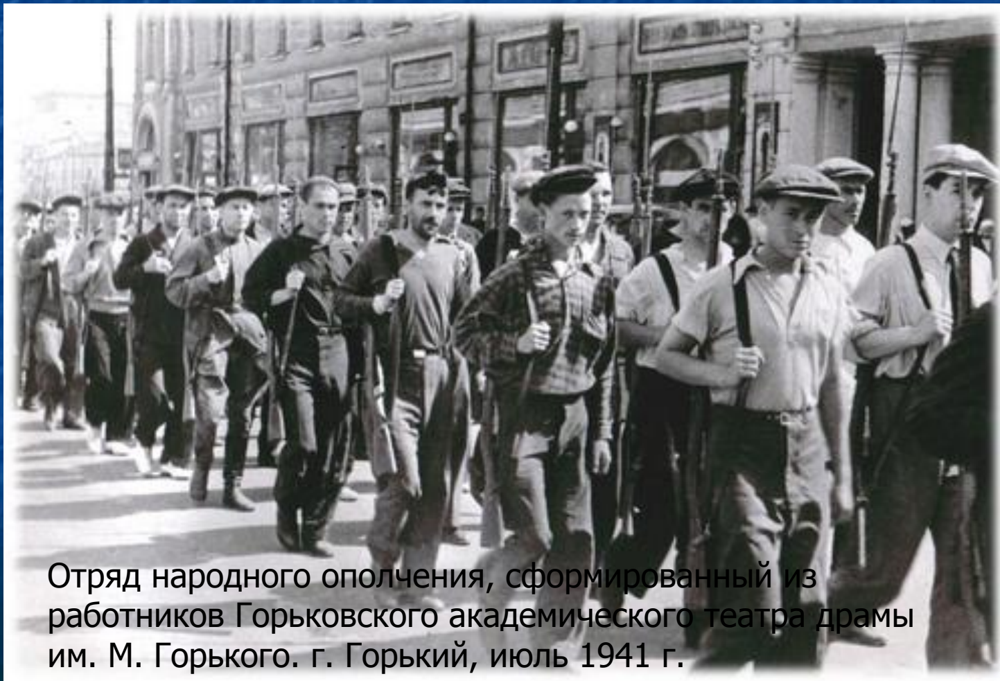
Отряд народного ополчения, сформированный из работников Горьковского академического театра драмы им. М. Горького. г. Горький, июль 1941 г.