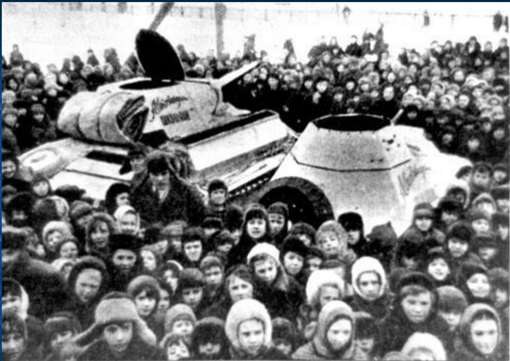
Передача танка и броневедомоцила «Автозаводский школьник» в Красную армию