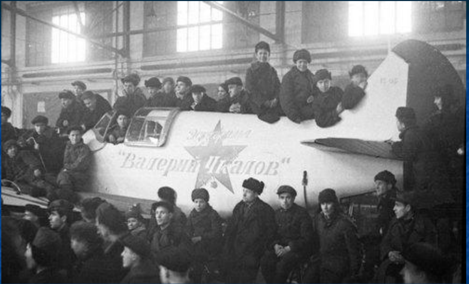
Митинг на заводе им. С. Орджоникидзе, посвященный передаче в Красную армию эскадрильи «Валерий Чкалов»