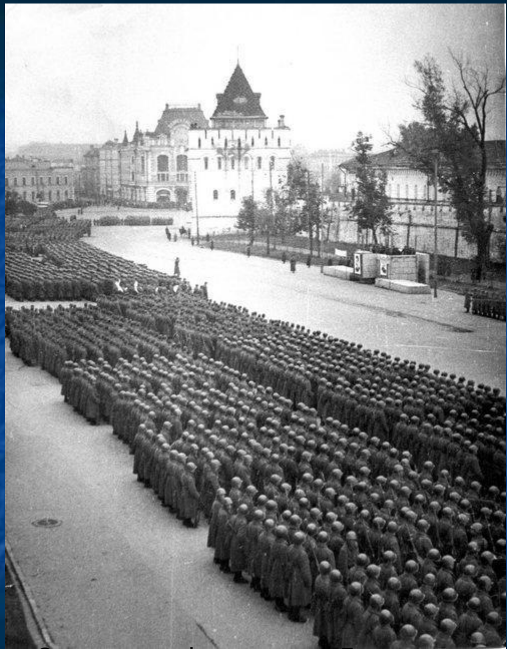
Отправка на фронт частей Горьковского формирования.