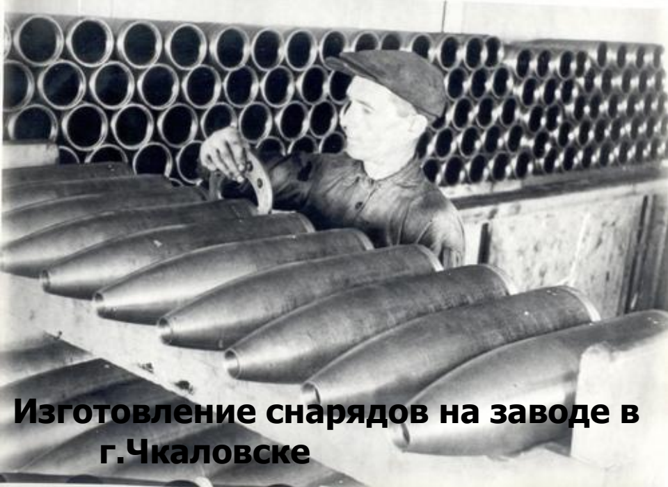
Изготовление снарядов на заводе в г.Чкаловске