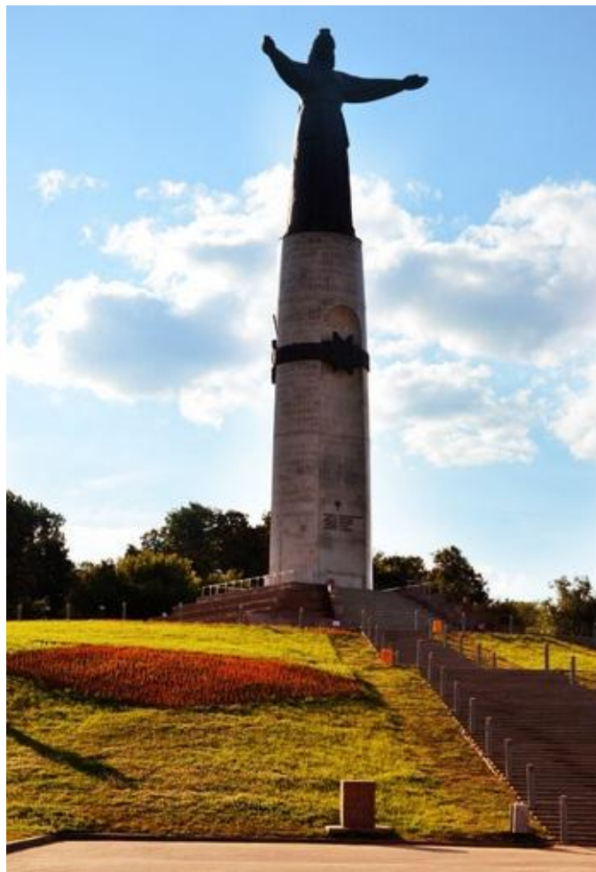
Монумент Матери Покровительницы