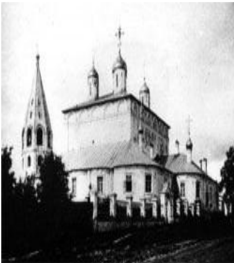
Введенский собор нач. XX века