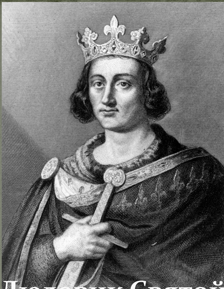
Людовик Святой Смелый