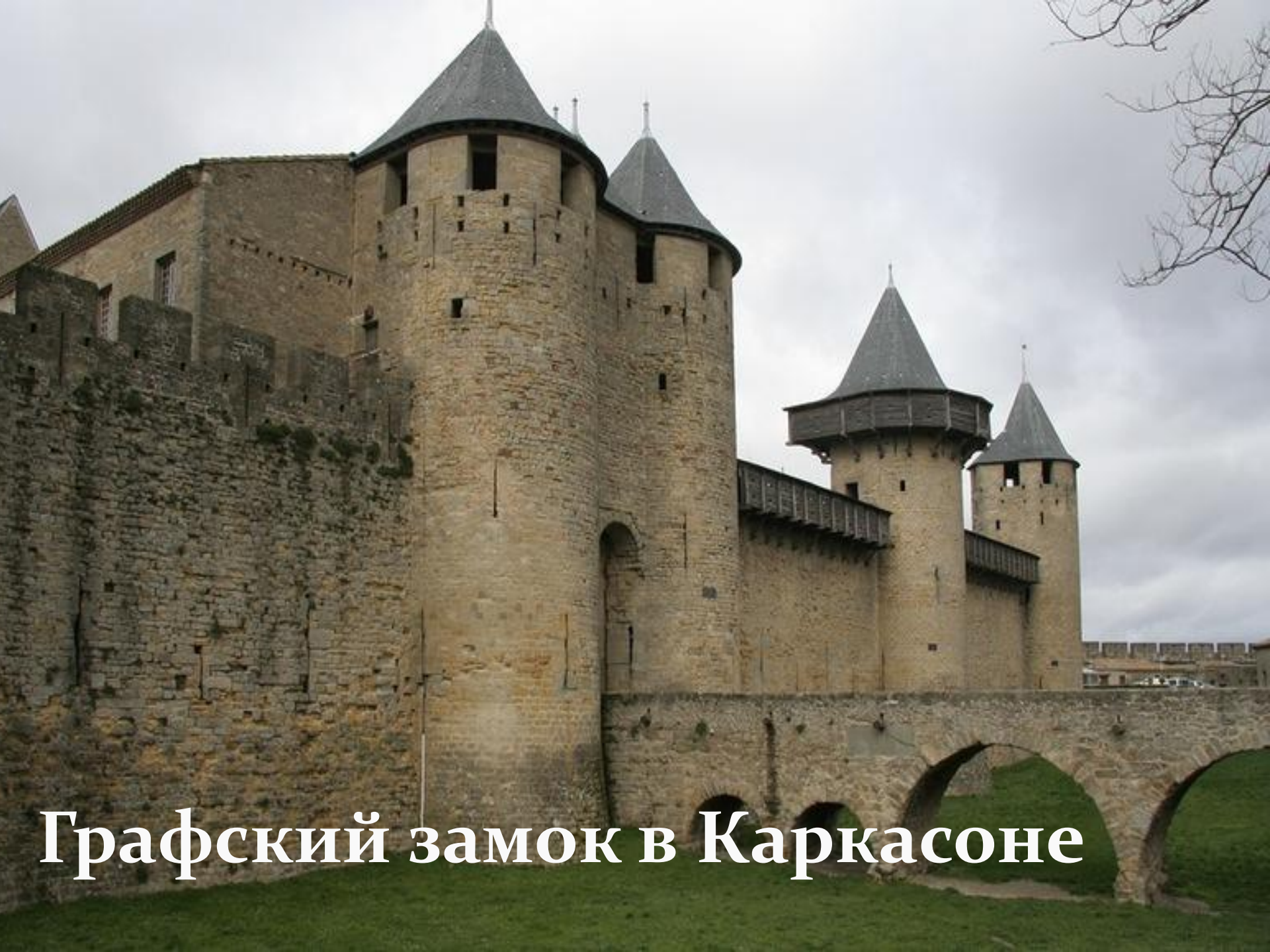
Графский замок в Каркасоне