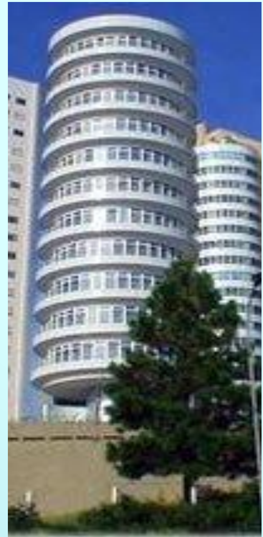
Вращающийся дом в Куритиба (Бразилия)