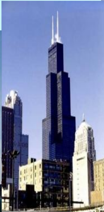
Сирс Тауэр, Чикаго, США.