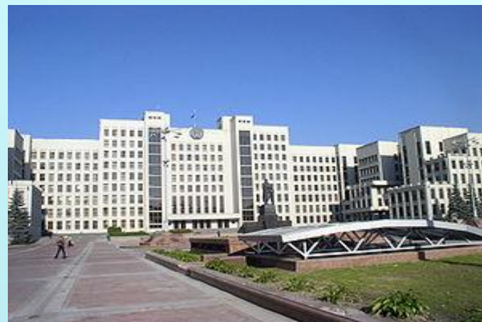
Дом правительства Республики Беларусь, построенный с 1930 по 1934 г.г.