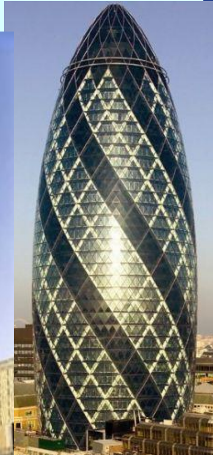
Главный офис страховой компании «Swiss Re», Лондон, Великобритания