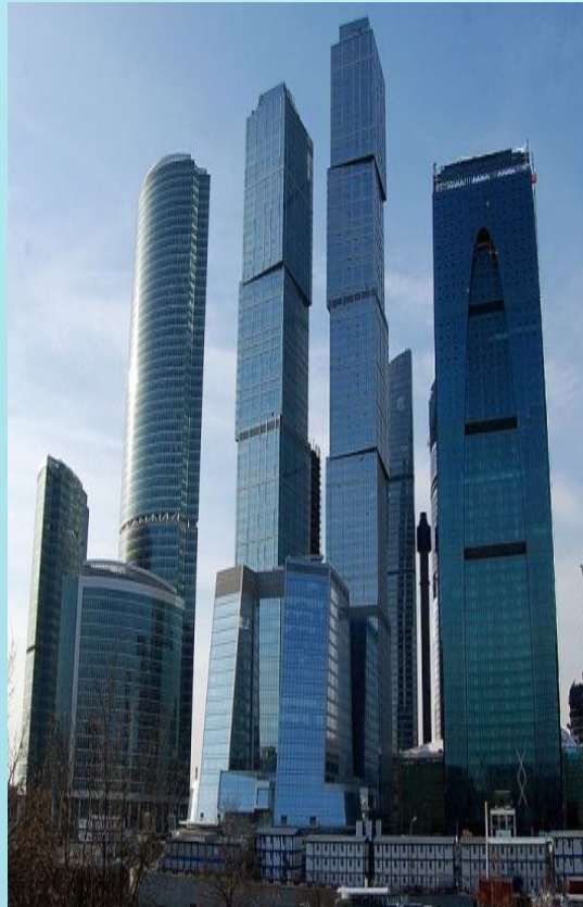
Москва-Сити, Москва, Россия