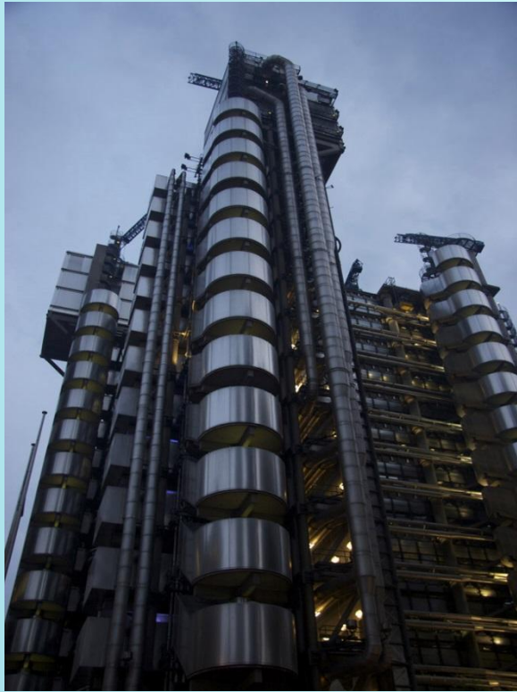
Офис корпорации Лоид Лондон, Великобритания.