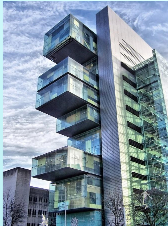
Манчестерский центр гражданского правосудия. Манчестер, Великобритания.