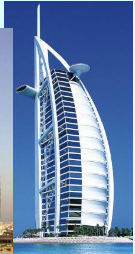
Burj Al Arab (отель Парус) Дубай, ОАЭ