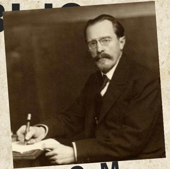
С. М. Прокудин- Горский