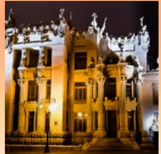
Дом с химерами.