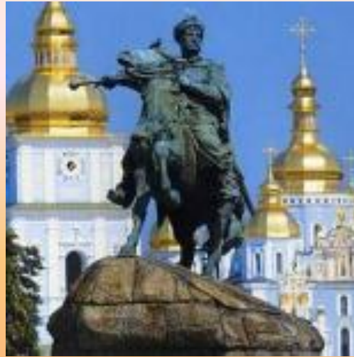
Памятник Богдану Хмельницкому.