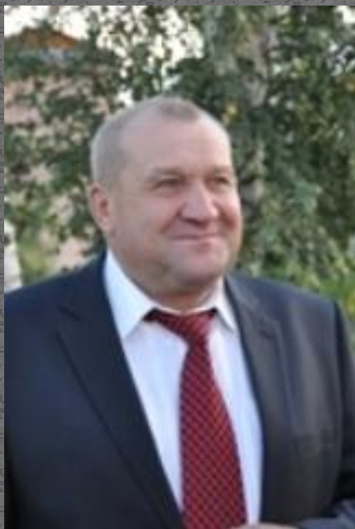
Глава администрации Русинов Юрий Филиппович

Глава администрации Павловского муниципального района осуществляет руководство администрацией Павловского муниципального района, обеспечивает ее функционирование, обеспечивает решение вопросов местного значения, решение которых в соответствии с Уставом Павловского муниципального района отнесено к его полномочиям.