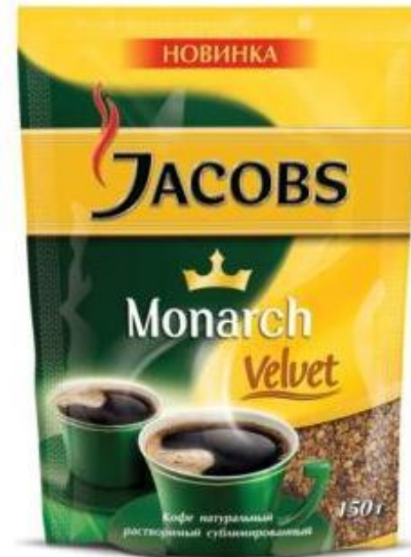
Рефилы – 150g