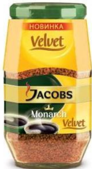
Банки – 95g