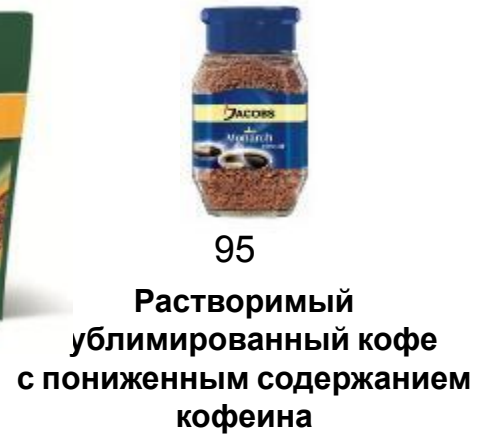
Растворимый сублимированный кофе