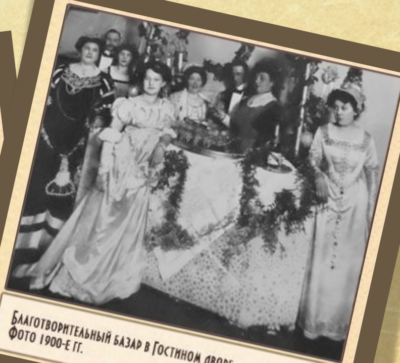
Благотворительный базар в Гостином дворе. Фото 1900-е гг.

В 1948 годах была проведена реконструкция здания по возвращению зданию первоначального облика. Еще одна реконструкция проводилась в 1954–1969 годах.