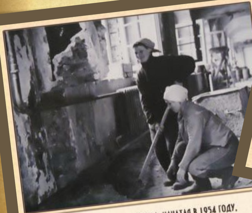
Реконструкция Гостиного двора, начатая в 1954 году, продолжалась 15 лет.