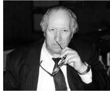
Василий Васильевич Давыдов

Образовательная система Д.Б. Эльконина-В.В. Давыдова имеет уже более чем 40-летнюю историю существования: сначала в виде разработок и экспериментов, а в 1996 году Решением Коллегии Министерства образования РФ образовательная система Эльконина-Давыдова была признана одной из трех государственных систем, наравне с традиционной системой и системой развивающего обучения Л.В.Занкова.