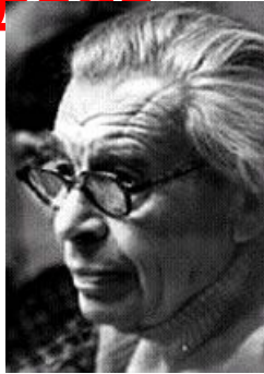
Даниил Борисович Эльконин