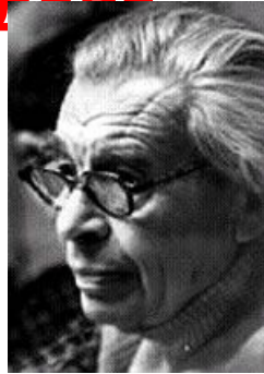
Даниил Борисович Эльконин