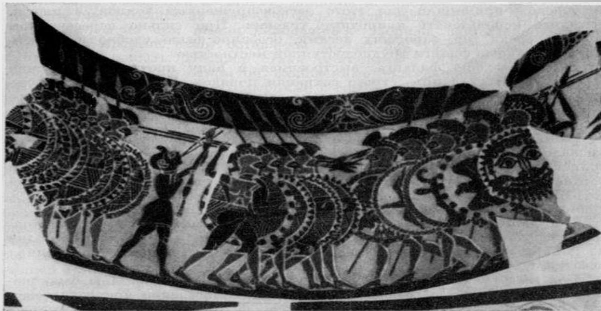
Бой фаланг. Ваза из собрания Киджи