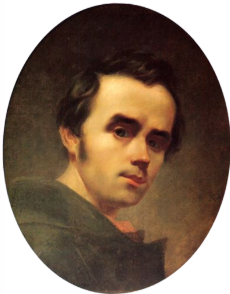
Автопортрет. 1840-1841 роки.

Поет, письменник (драматург, прозаїк); художник (живописець, гравер, збереглося 835 творів). Народжений у кріпацтві, досяг вершин людської творчості. Член Кирило-Мефодіївського братства. Академік Імператорської академії мистецтв (1860). Це наш Кобзар, український Пророк, завдяки якому збережено мову, відроджено націю.