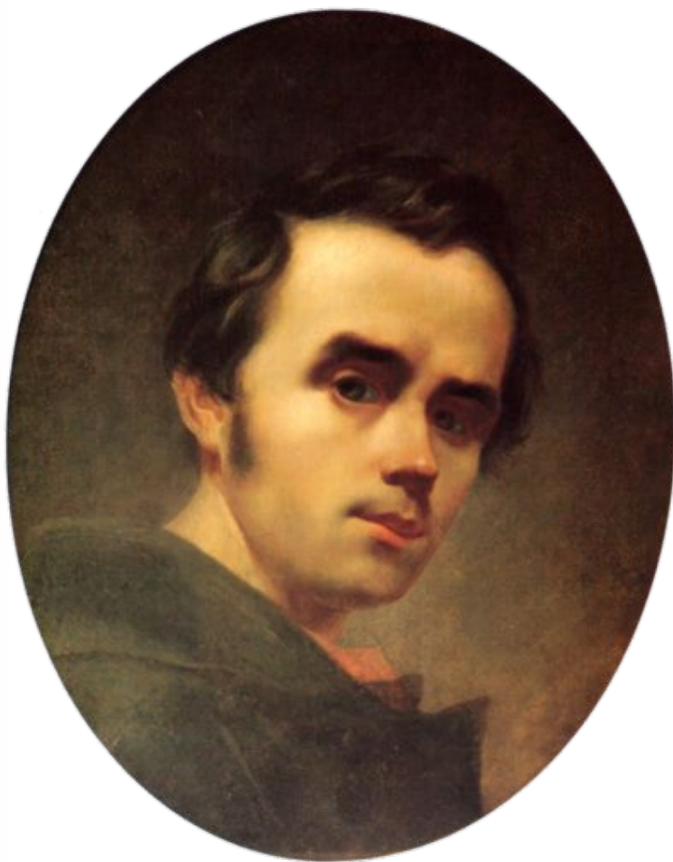
Автопортрет. 1840-1841 роки.

Поет, письменник (драматург, прозаїк); художник (живописець, гравер, збереглося 835 творів). Народжений у кріпацтві, досяг вершин людської творчості. Член Кирило-Мефодіївського братства. Академік Імператорської академії мистецтв (1860). Це наш Кобзар, український Пророк, завдяки якому збережено мову, відроджено націю.