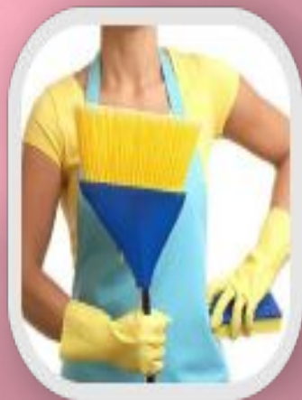
Влажная уборка помещения