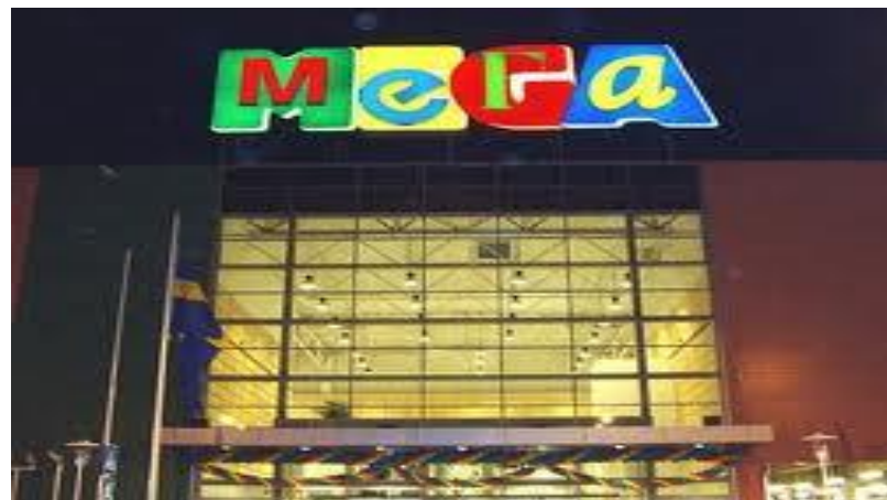
Мега, г. Краснодар