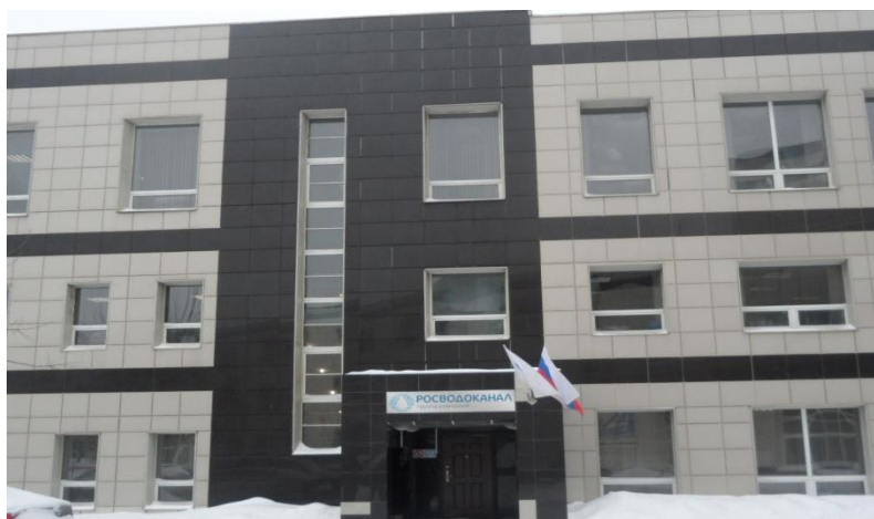
«Росводоканал», Гамсоновский переулок 2