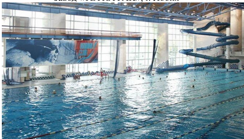
Бассейн «ЦСК ВМФ»