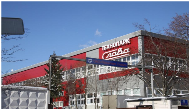
«Технопарк Слава», Научный проезд 20/2