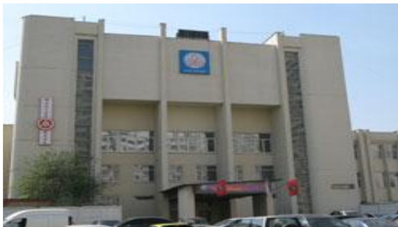
НПО «Взлет», ул. Производственная 6