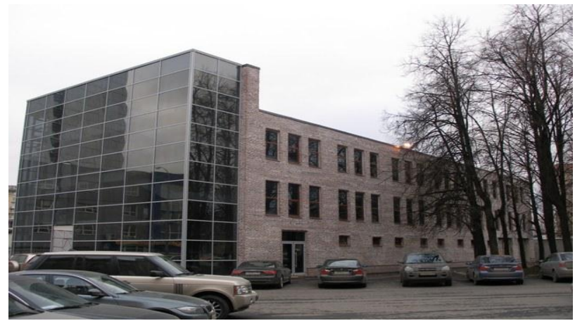
БЦ «Омега Плаза»