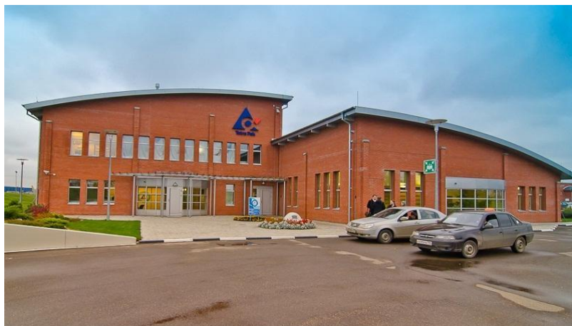
Завод «TETRA PAK», г. Лобня