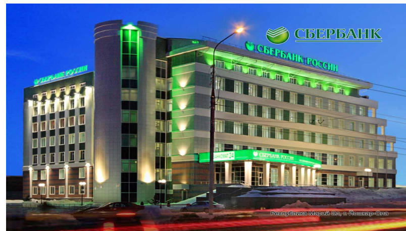
Сбербанк России (несколько отделений)