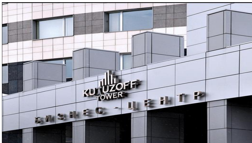
БЦ«KUTUZOFF TOWER», Ивана Франко 20