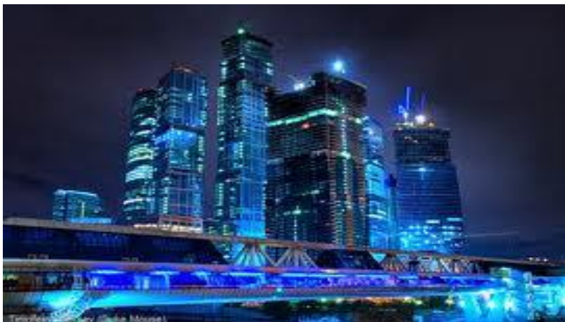
БЦ «Москва Сити»