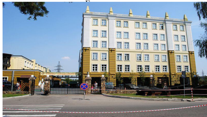
Музей техники Вадима Задорожного