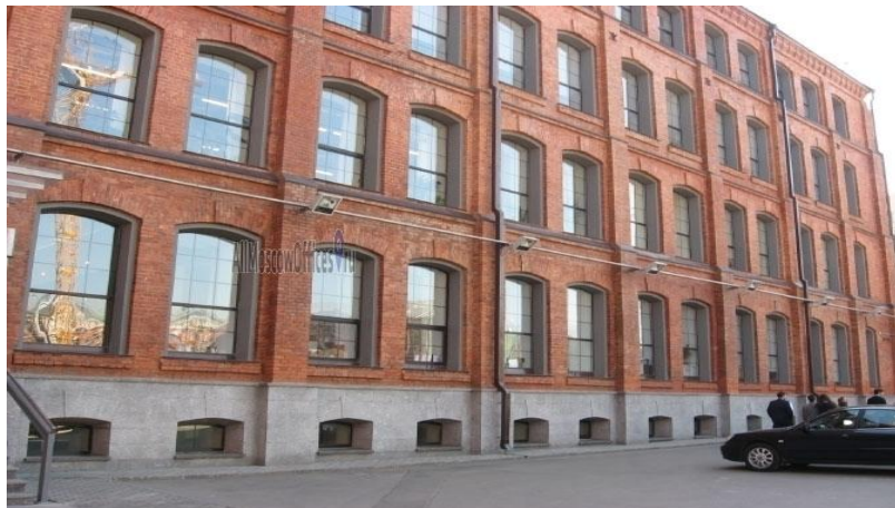
«Красная Роза 1875», ул. Тимура Фрунзе к.44/45