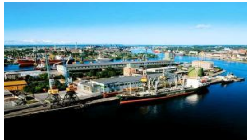
Калининградский морской рыбный порт