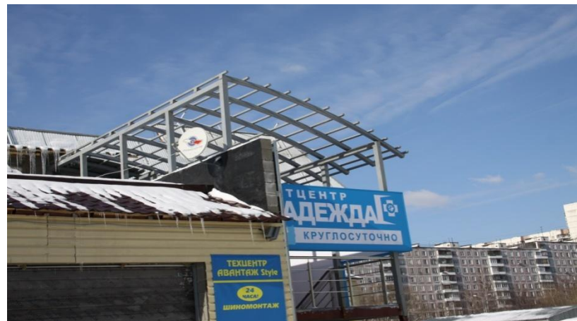
ТЦ, ул.Вильнюсская 5 (изготовление металлоконструкции)