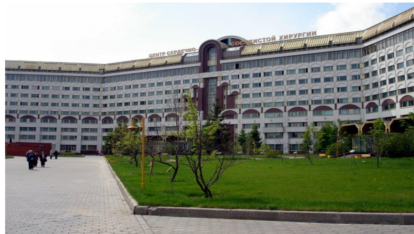
Научный центр сердечно-сосудистой хирургии им. А.Н.Бакулева