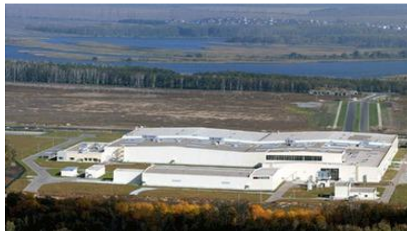
Завод «YOKONAMA», Липецк