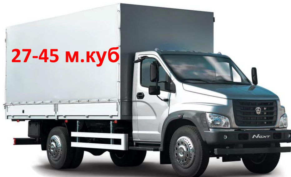
Двигатель ЯМЗ-53444 CNG