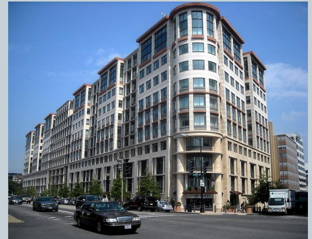
Здание Международной финансовой корпорации в Вашингтоне

IFC осуществляет предоставление займов, инвестирование в форме долевого участия в капитале, предлагает структурированное финансирование и продукты по управлению рисками, а также оказывает консультационные услуги в целях стимулирования роста частного сектора в развивающихся странах. В отличие от МБРР IFC не требует государственных гарантий по предоставляемым средствам.