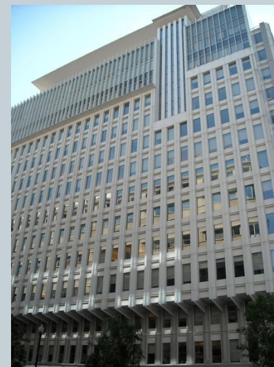
Штаб-квартира группы Всемирного банка в Вашингтоне