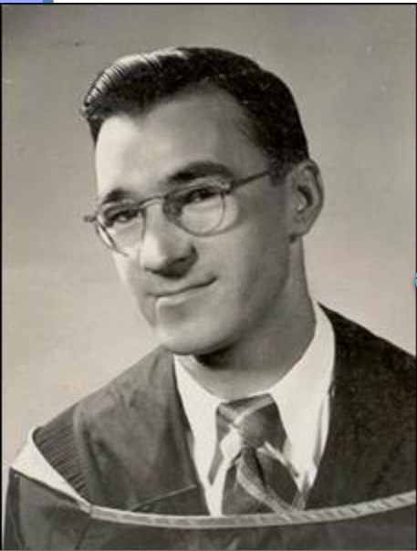
Курт Левин (ам. и нем. психолог) (1890-1947)

совокупность приемов, применяемых лидером для оказания влияния на остальных членов группы