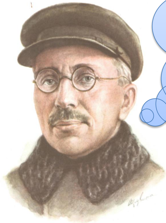
Антон Семенович Макаренко [1888—1939]

Педагогическая поэма. Книга для родителей. Повести: Марш 30 года, — ФД — 1, — Флаги на Башнях.