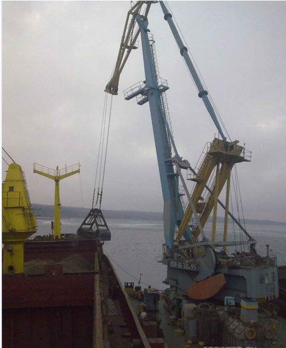
Грейферный захват для перегрузки массовых грузов