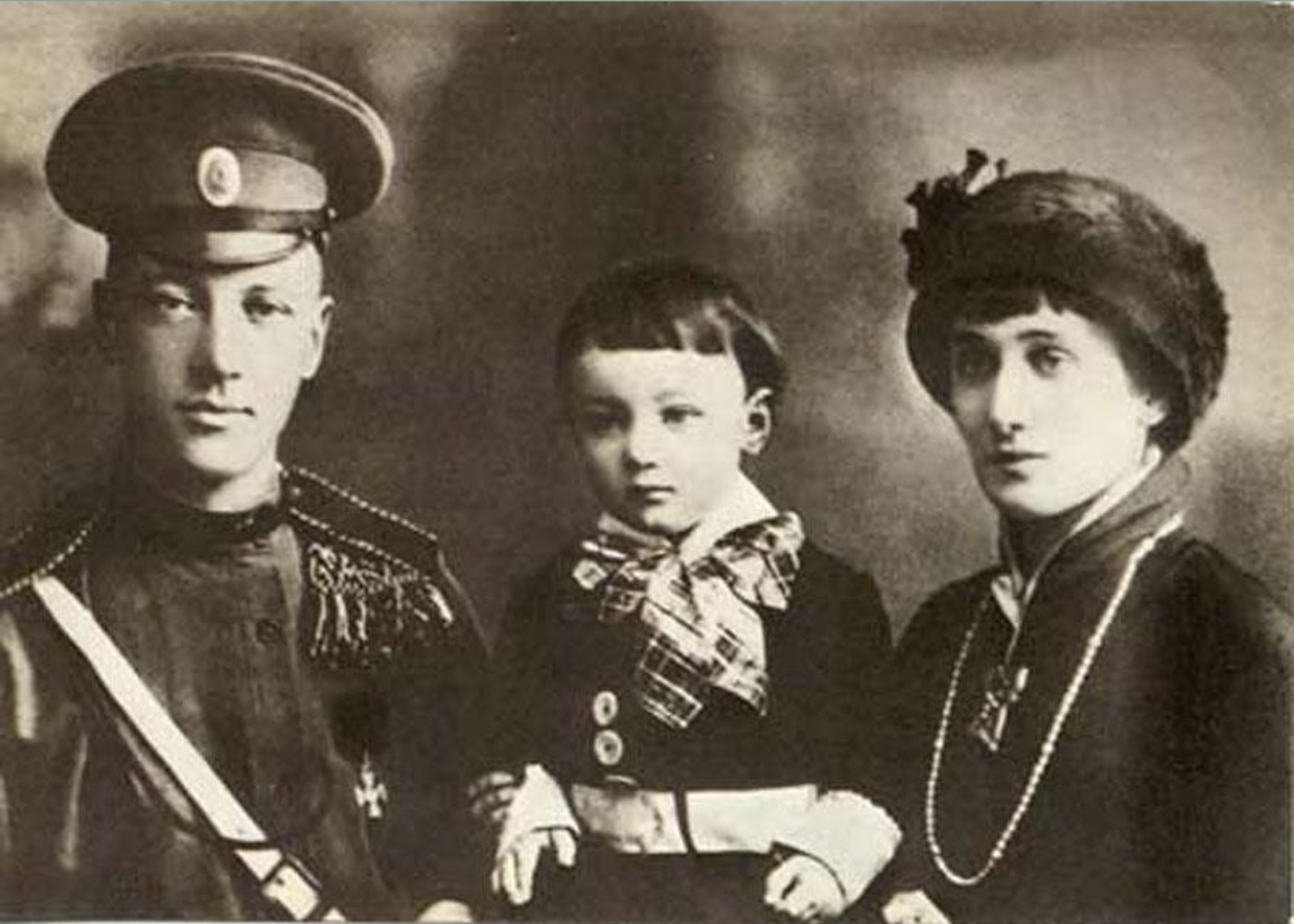
Н.С.Гумилев, Лев Гумилев, А.А.Ахматова. Царское Село. 1916г.