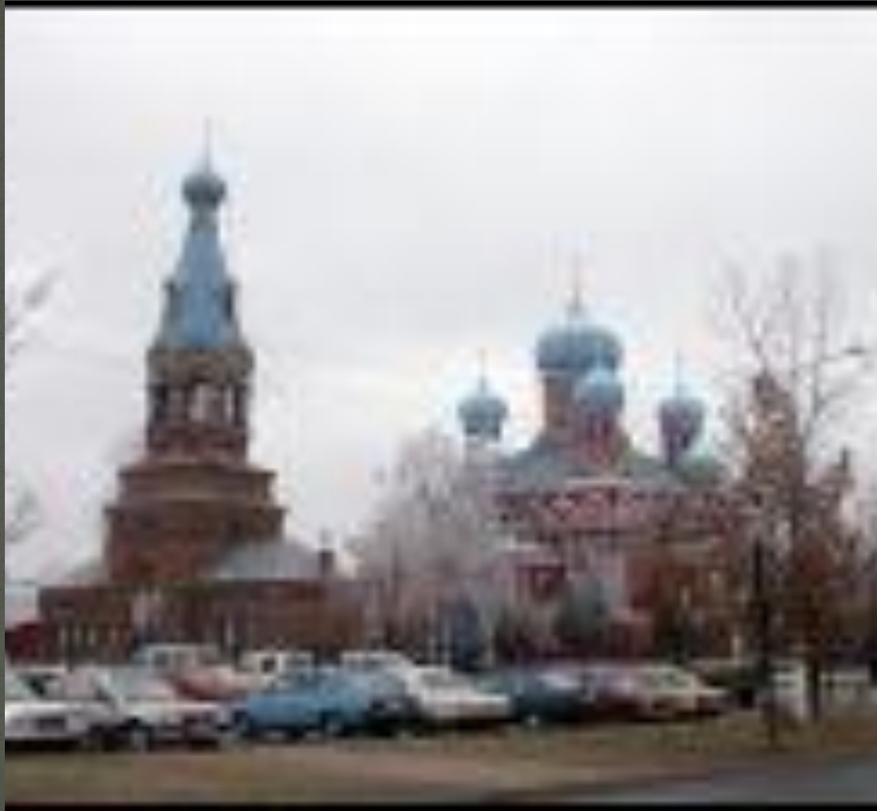
Собор Воскресения Господня