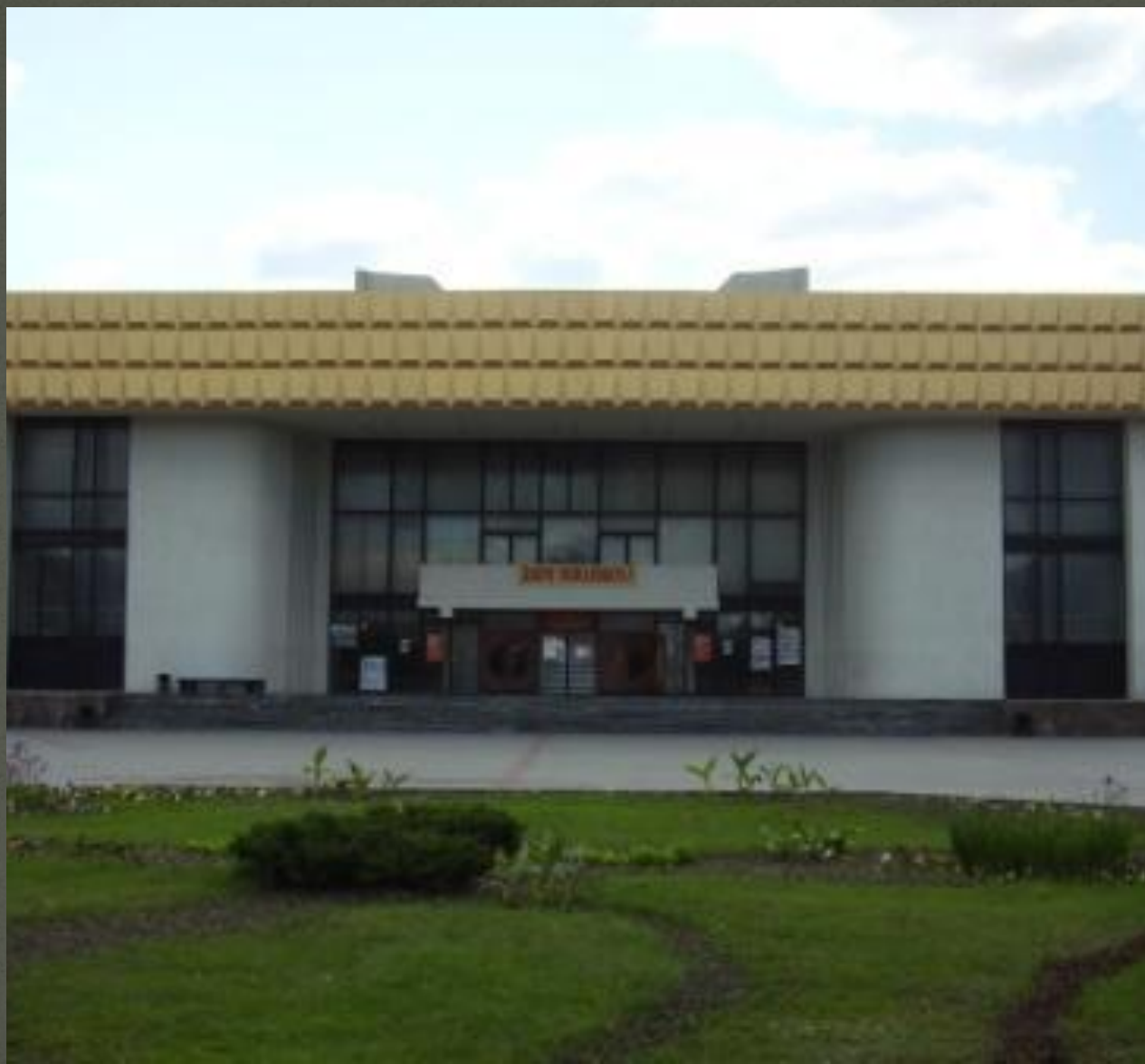
Дворец культуры им. М. Горького