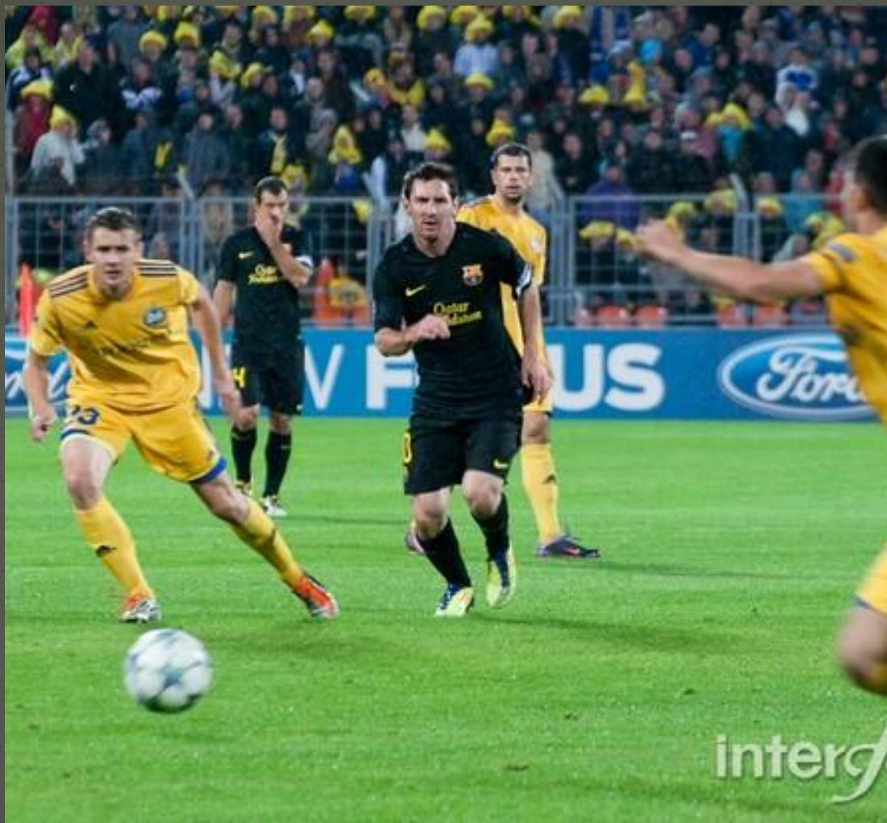
Борисовский клуб «Батэ»