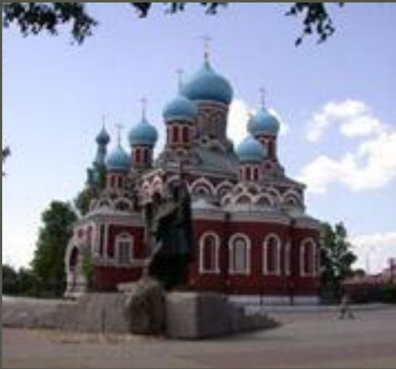
Воскресенский собор (г.Борисов)