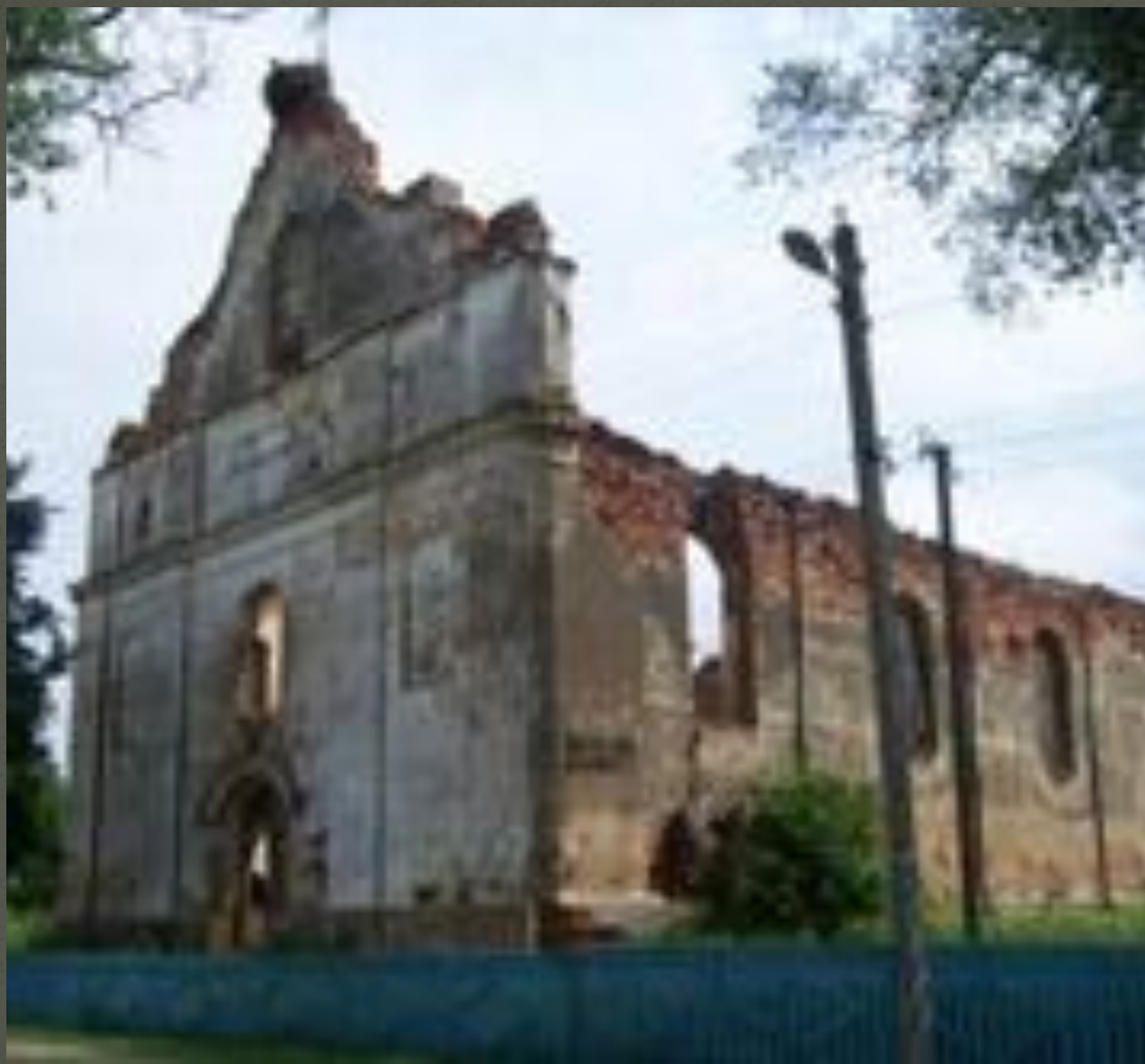
Доминиканский костел (д.Зембин)