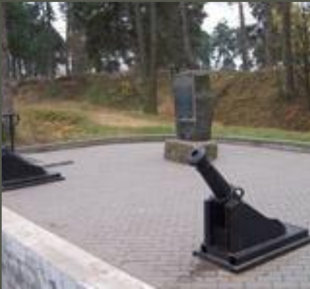
Остатки земляных фортификацион ных формирований “Батарея”(г. Борисов)