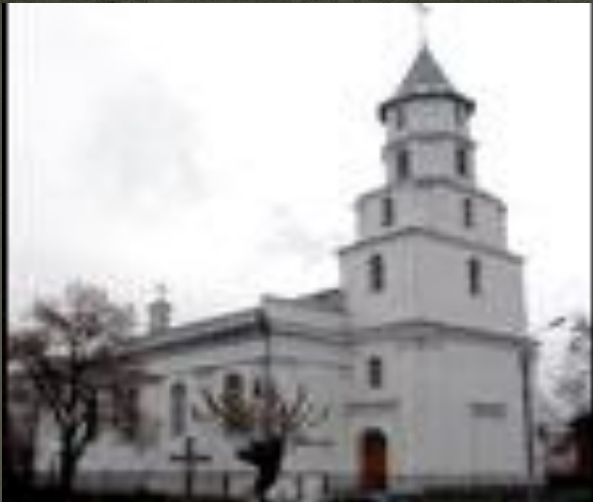
Костёл Рождества Пресвятой Девы Марии