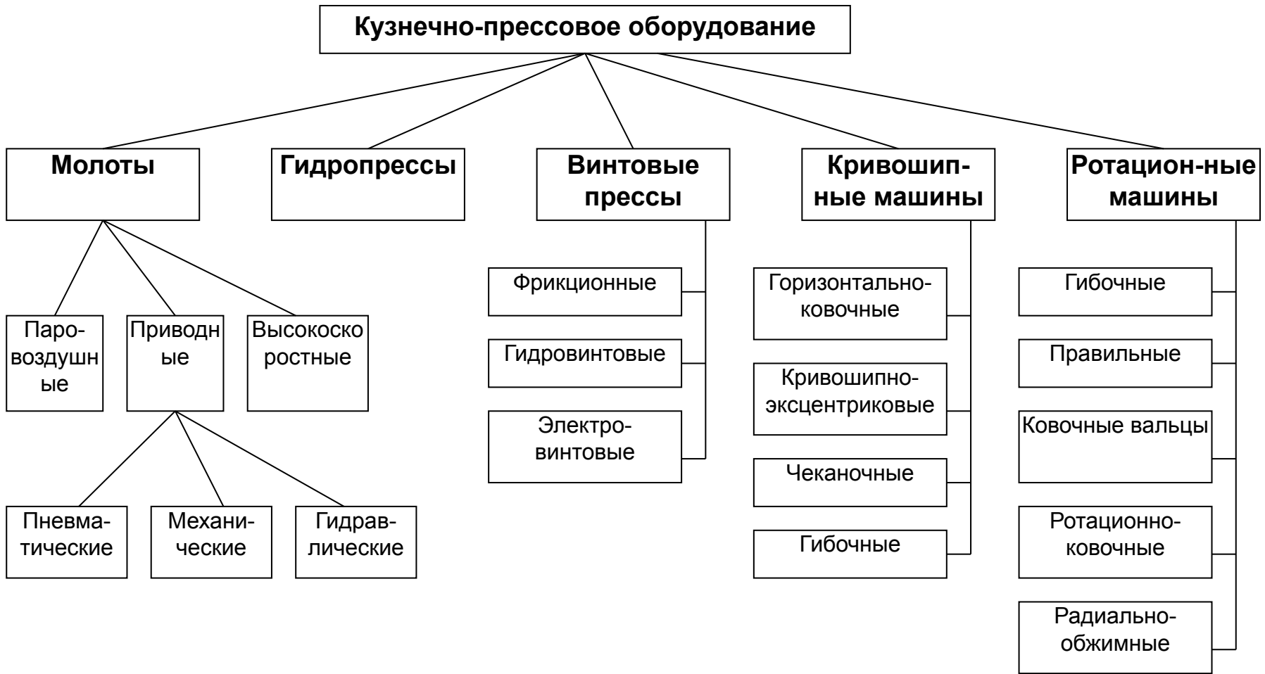
Рисунок 6.1 – Классификация кузнечно-прессовых машин

Описанные виды пластической деформации справедливы дляковки на традиционном кузнечно-штамповочном оборудовании, рисунок 6.1.