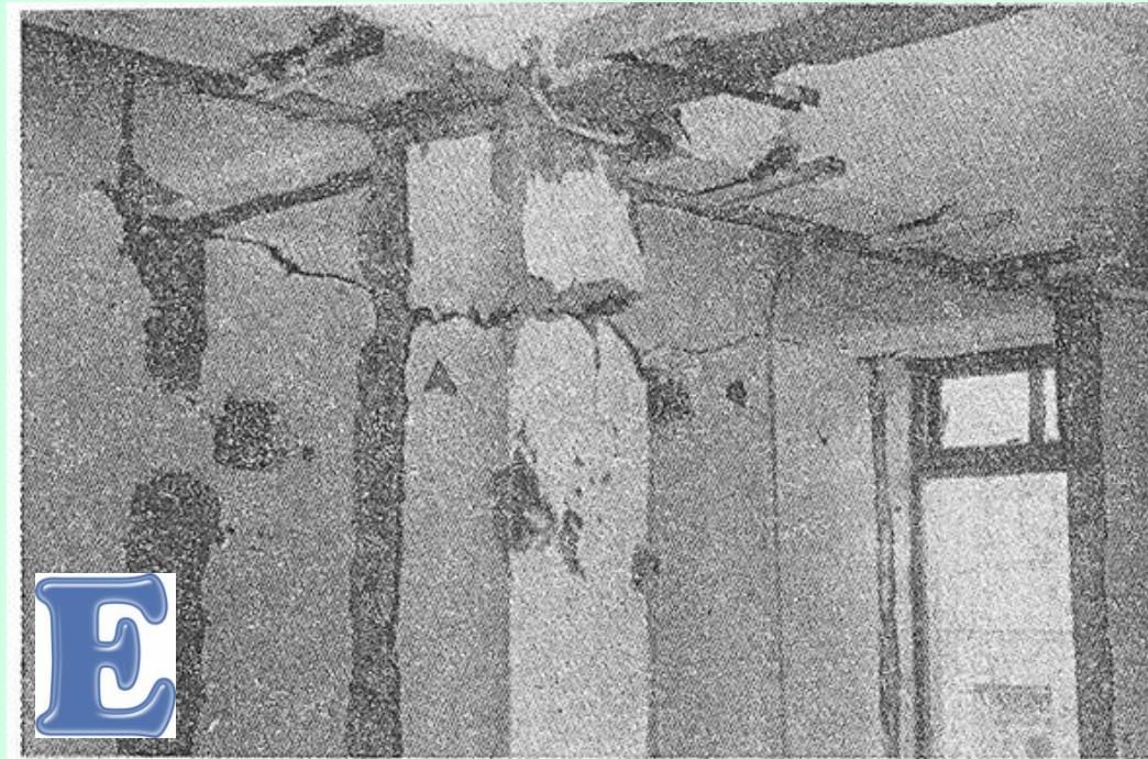
Рис. 2.2. Повреждение монолитной железобетонной колонны первого каркасного этажа пятиэтажного жилого дома в Буйнакске (расчетная сейсмичность 7 баллов)