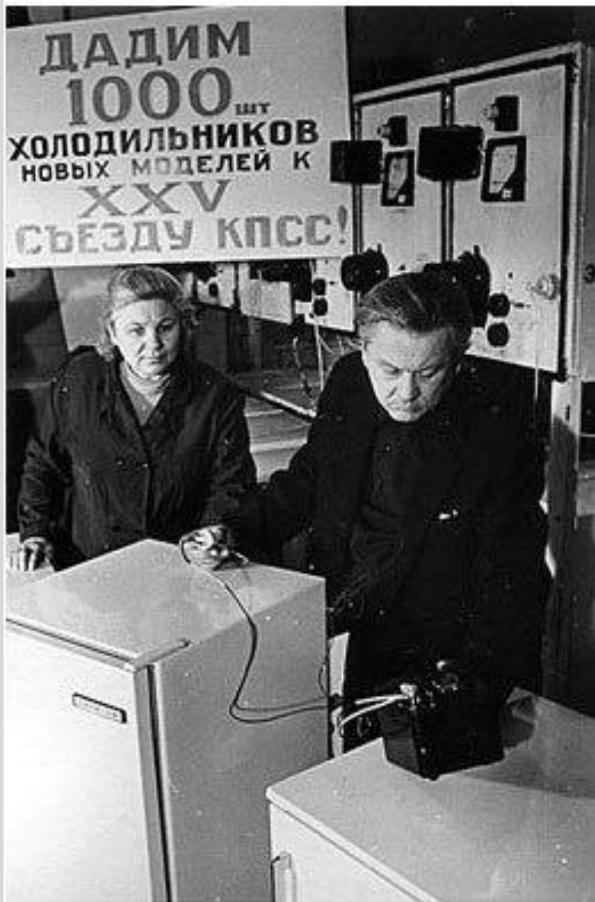
Холодильники по заданию партии