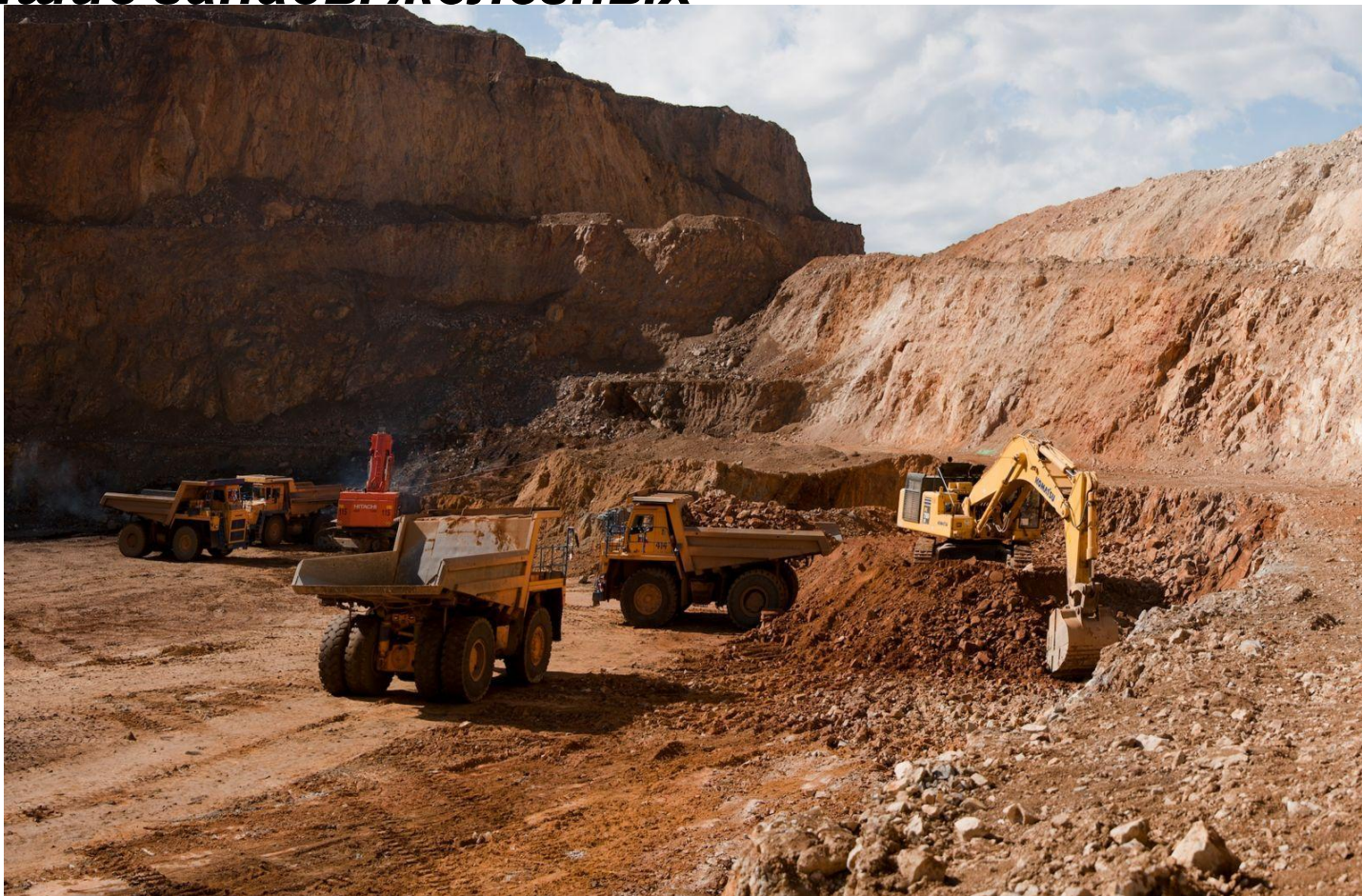
Добыча железной руды на КМА

Главными особенностями южной части центральной России являются плодородные черноземные почвы и богатейшие запасы железных руд КМА