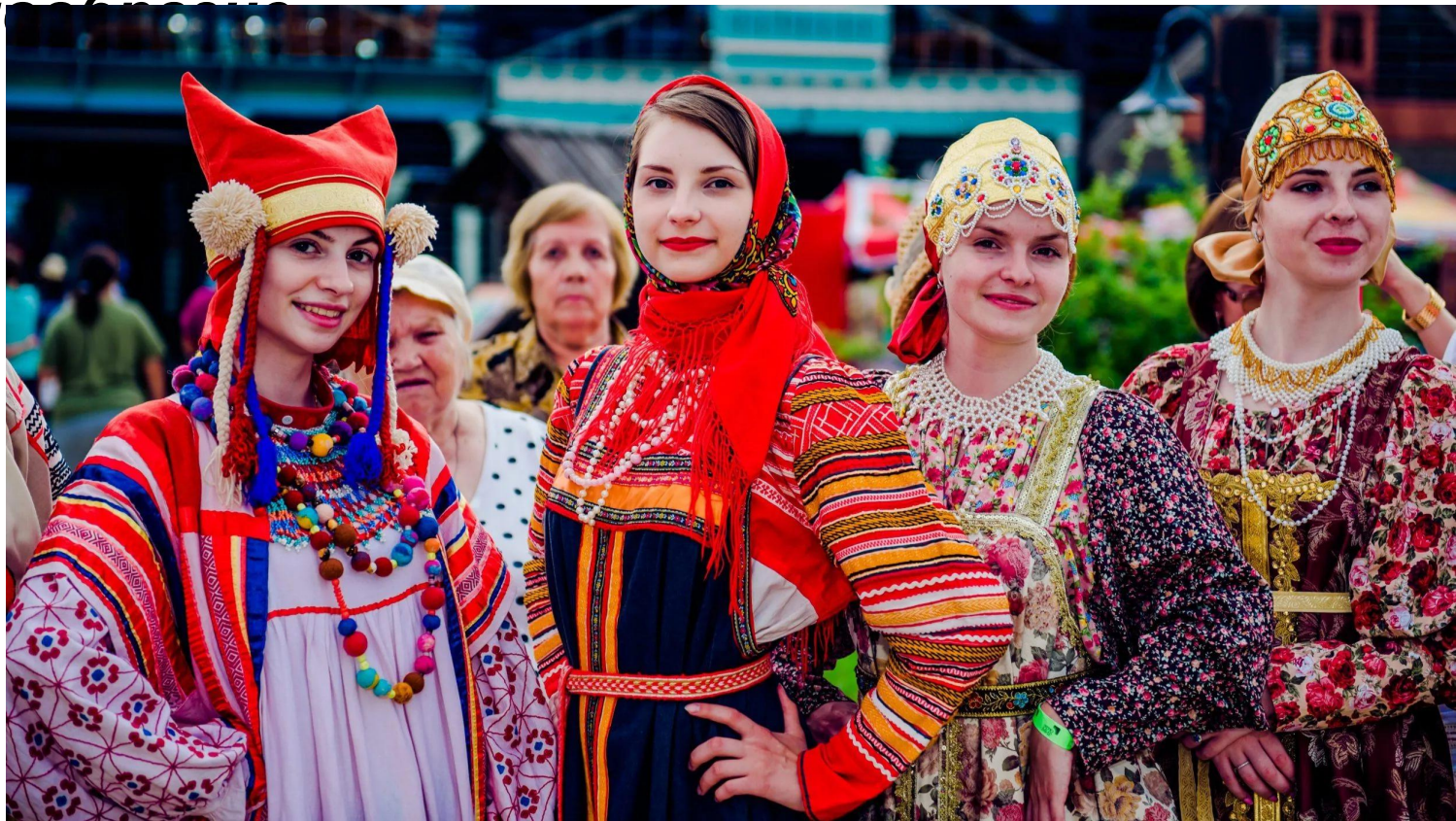
Этнические группы восточной части центральной России

Основные особенности восточной части центральной России выгодное географическое положение, территориальная неоднородность и этническое разнообразие