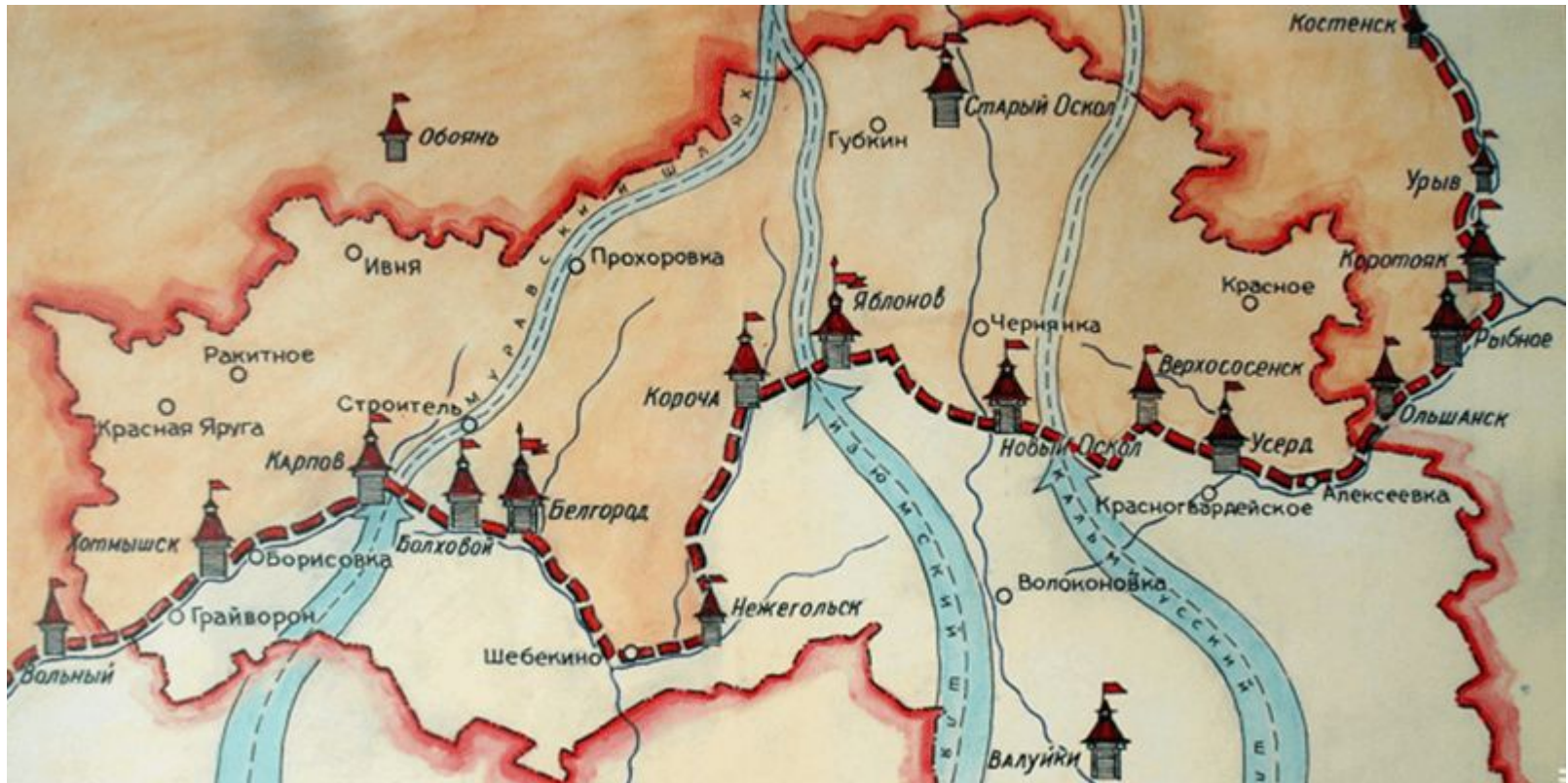
Белгородская засечная черта

Заселение лесной зоны, более безопасной и защищенной от набегов, шло быстрее. Освоение степной зоны происходило постепенно, по мере укрепления государства.