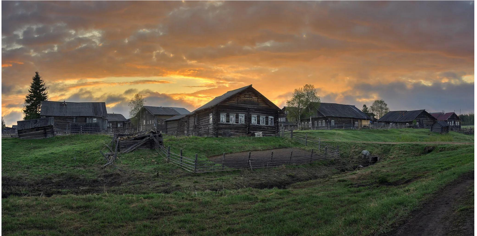
Ландшафт сельской местности

Проблемы сельской местности центра - в нарушении гармоничной связи между деятельностью человека и окружающими ландшафтами и оттоке наиболее активного населения в города